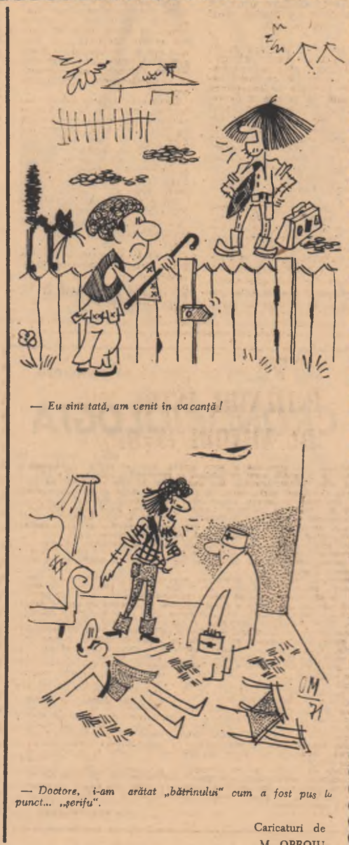
Caricaturi de M. OPROIU

Personajele (într-o ordine care poate fi interzată): 1) EL (un individ minat de incertitudini); 2) EA (o femeie cu experiență); 3) ALTUL (un domn cinic, cu barbă și fîșină de zgardă un căfel de rasă, gest care într-un fel îl umanizează); 4) ALTA (o brunetă sentimental-patetică); 5) SURDO-MUTUL (personaj ciudat). Actul I-IV (spectacol non-stop) EL — Care-o fi acum ora exactă la Tananariv? EA — Lasă detaliile, lucrurile trebuie pricite în mare... ALTUL — Ehe! Draga mea, dubiile fac suflatul mai frumos! Uite eu... ALTA — Adevărată oră exactă e ora sentimentelor înălțătoare... Eu percep timpul alectiv și mă aflu, o spun cu mîndrie, cu cîteva minute înainte de ora sublimului. Mă așteaptă ora sublimului. EA — După cîte am înțeles vrei să te muți din blocul nostru? EL — Dar știm noi ce-i acela sublimul? ALTUL — Chiar așa? Adevăratele sentimente sînt cele retroactive. O să vă dau un exemplu edificator: ieri am sosit. Mi-am adus aminte cum am copiat la un extemporal la matematică în clasa a cincea elementară... EA — Am senzația că sîntem prea generoși, prea ne cheltuim ideile și sentimentele. Mi-am risipit naivitatea pînă la 21 de ani și regret, dacă așa putea să mă fiu acum naiv... Măcar de două ori pe săptămîină... Ce zic de două ori, măcar o dată sau două nu, cel puțin să pot mîna naivitatea... SURDO-MUTUL — (strănută și toși se uită la el)... EL — O fi un strănut autentic, ori unul semnificativ? SURDO-MUTUL (mai strănută o dată și țese din scenă)... I. ALEXANDRU