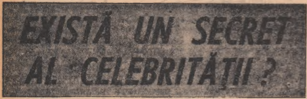
Anchetă internațională de CAROL ROMAN

Laureați ai Premiului Nobel răspund la întrebarea: