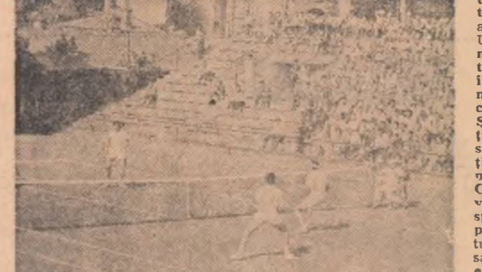
Tenismenții noștri, învingînd echipa R.F.G. cu categoricul scor de 6-0, au înscris un nou succes de prestigiu în palmaresul lor.