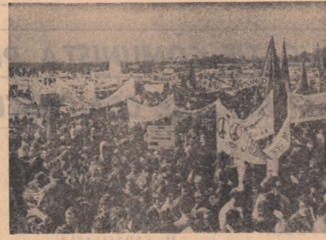
Aspect de la o demonstrație a tineretului francez pentru pace, împotriva imperialismului imperialiste. Din „JEUNESSE DU MONDE”