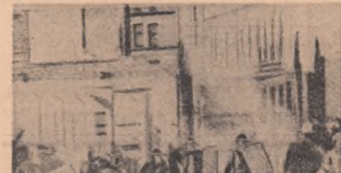
O scenă devenită „clasică” în Irlanda de Nord: soldații britanici în timpul unei ciocniri cu demonstrații pe străzile din Londonderry

PARIS 18 (Agerpres). — Privit unei informări a revistei „Africaasia”, achizițiile portugheze de substanțe defoliante din S.U.A., în scopul distrugerii vegetației în regiunile angoleze controlate de forțele patriotice, au crescut în primul lui ale acestui an de circa patru ori în comparație cu perioada corespunzătoare a anului trecut. Astfel, prin folosirea acestor substanțe, colonialiștii au provocat recent distrugerea a 4000 de hectare de plantații în Angola. După cum au subliniat în repetate rânduri reprezentanții mișcării de eliberare din această țară, aliații Portugaliei în războiul chimic pe care-l duce împotriva populației angoleze sînt partenerii săi din cadrul N.A.T.O., care dotază armata portugheză cu mijloace tehnice necesare operațiilor pe care le desfășoară pe continentul african.