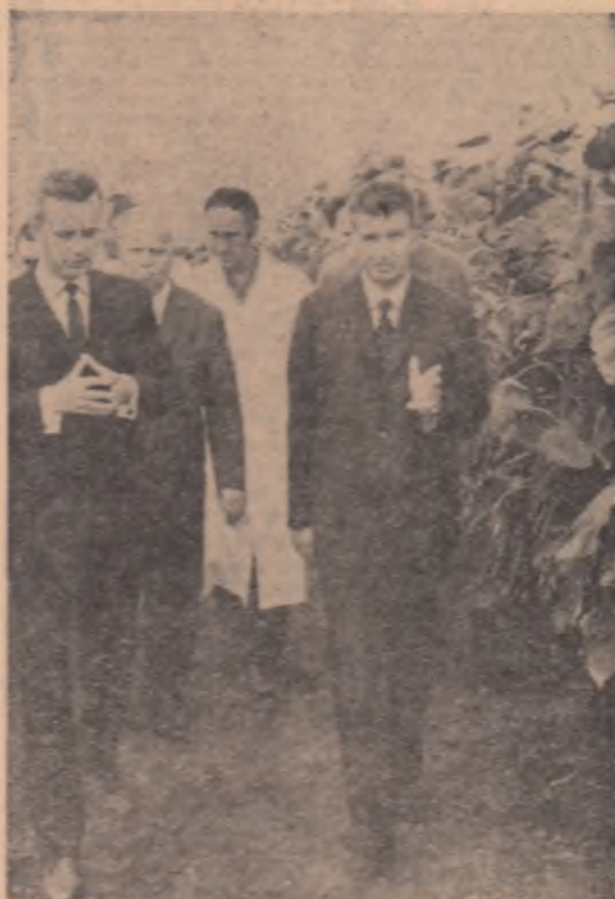
Reuniune în biroul lui Ceaușescu.