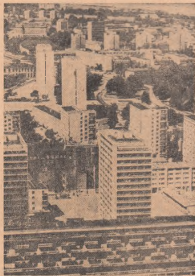
Varsavia își îmbogățește peisajul cu noi construcții. În fotografie o imagine dintr-un nou cartier al capitalei poloneze.

KATOWICE — Trismul special Agerpres, Gheorghe Ciobanu, transmite pentru „Știința tineretului”: La Katowice a avut loc deschiderea festivităților printr-o mare sărbătoare celebră aniversarea zilei naționale. La aceste manifestări, organizate de Uniunea Tineretului Socialist, împreună cu alte organizații, participă 6100 delegați precum și reprezentanți ai unor organizații de tineret de peste hotare printre care și delegația Uniunii Tineretului Comunist din România.