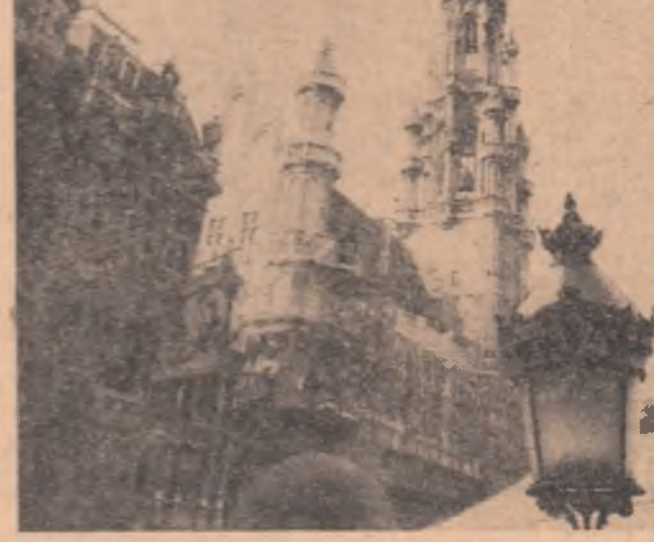
Astăzi se sărbătorește aniversarea proclamării independenței Belgiei. În fotografie: imagine din Bruxelles.

Zborul stației științifice orbitale continuă.