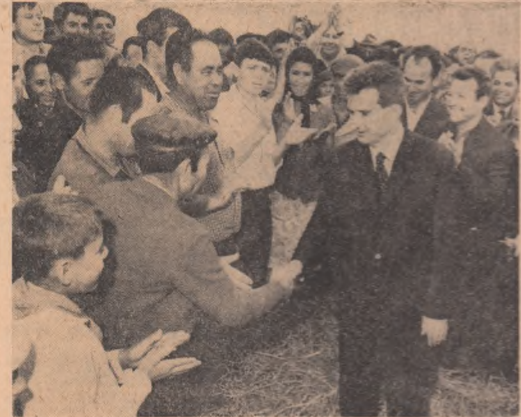
In vizită la cooperativă de la Costești.

de țărani cooperatori, activitatea organizatorică a cadrelor de conducere din cooperative și din ferme, gândirea inginerilor, munca mecanizatorilor. Ca de fiecare dată, prezența în mijlocul lucrătorilor pămintului, a secretarului general al partidului, a celorlalți conducători de partid și de stat, a constituit un puternic factor mobilizator, un prilej