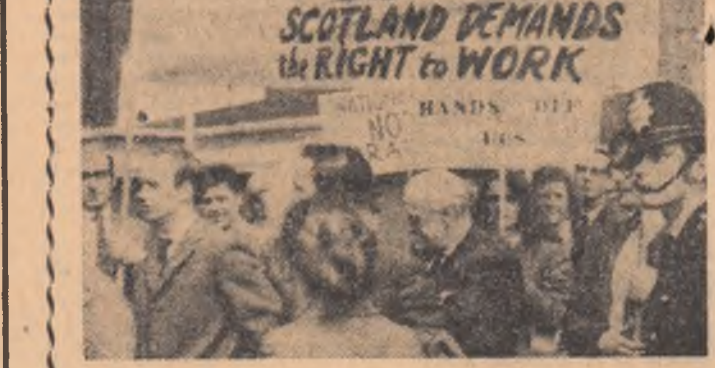
„SCOTIA CERE DREPTUL LA MUNCA, NU VREM UN NOU 1930” — scrie pe pancartele purtate la o demonstrație la Londra de o delegație a muncitorilor de la „Upper Clyde Shippbuilders”.

este cu atât mai puternic resimțit cu cât în Scoția, unde se află șantierele marului concern naval, șomajul a atins, oricum, o dată mai ridicată decât în alte regiuni ale Angliei. Acest „șoc” este cu atât mai preocupant cu cât se înscrie într-o succesiune de falimente. După societatea constructoare de automobile și motoare de avion „Rohs Royce” și după una din cele mai mari firme de asigurări auto „Vehicle