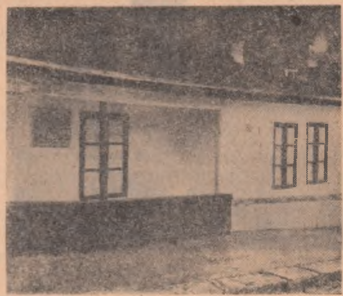
În această clădire modestă de pe strada Ecoului a funcționat în iulie-septembrie 1932, în a cărui ilegalitate, redacția ziarului „Scinteia”

(Sintem pe unul din bulevardele liniștite ale orașului, Nicolae Titulescu, la nr. 35). De aici așezăm repede, mergînd pe calea Criticiei, la nr. 261. În acest local, care a găzduit sindicatele C.F.R., în luna decembrie 1932 s-a ținut ședința Comitetului de acțiune a muncitorilor ceteristi, în vederea pregătirii acțiunilor greviste din februarie 1933. Și cîțiva pași mai departe, locul care a rămas înscris cu litere de sînge în istoria luptei revoluționare a clasei