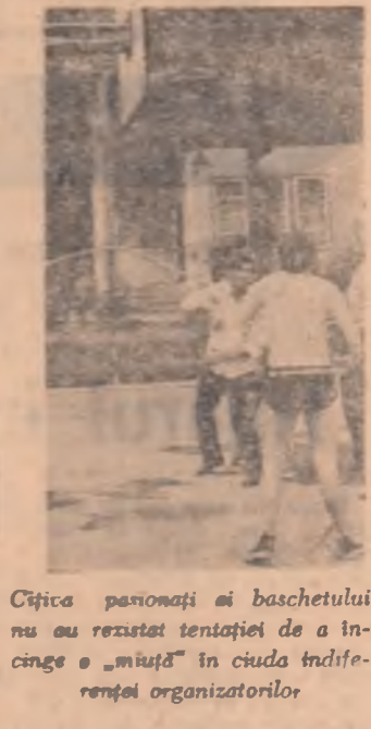
Cîțiva pasionași ai baschetului nu au rezistat tentației de a încinge o „mușcă” în ciuda îndrăgînitelor organizatorilor.

te aici au rămas cu un pas în urma necesităților și cerințelor firești ale vizitatorilor. Nu ai se va putea explica, spre exemplu, de ce conducerea taberei nu a luat din timp măsurile necesare pentru ca studenții — cu atît mai mult cu cît tabăra are și un caracter de instruire — să poată citi presa cotidiană și periodicele. Ne-am fi așteptat ca în biblioteca taberei să găsim cel puțin ziarul „Scinteia” și „Scinteia tineretului”, revistele „Tînrul leninist” și „Viața Studentească”. Mai ales că presa ajunge tîrziu sau deloc chiar pe filiera normală, adică la localitate. Și totuși, în aceste zile de efervescență politică și ideologică, presa centrală lipsește din tabăra de la Izvorul Mureșului. Nu negăm că o astfel de deficiență rapid remediată. În ce privește activitatea sportivă, un alt element necesar în viața oricărui colectivitate de tineri care se desfășoară cu totul la împlinire, în afara unui program de minimum de organizare ce folosec că terenurile de volei, baschet și handbal au fost asfaltate și împrejmuite (cu sînt necesare o serie de perfecționări: marcarea terenurilor, fixarea aparatului și a accesoriilor etc.), dacă conducerea taberei (aparținînd U.A.S.R.) se mulțumește cu organizarea a una-două excursii și a serilor de dans? Iată un subiect asupra cărui organizatori scriitorii vitoare vor trebui să se aplece cu mai multă atenție.