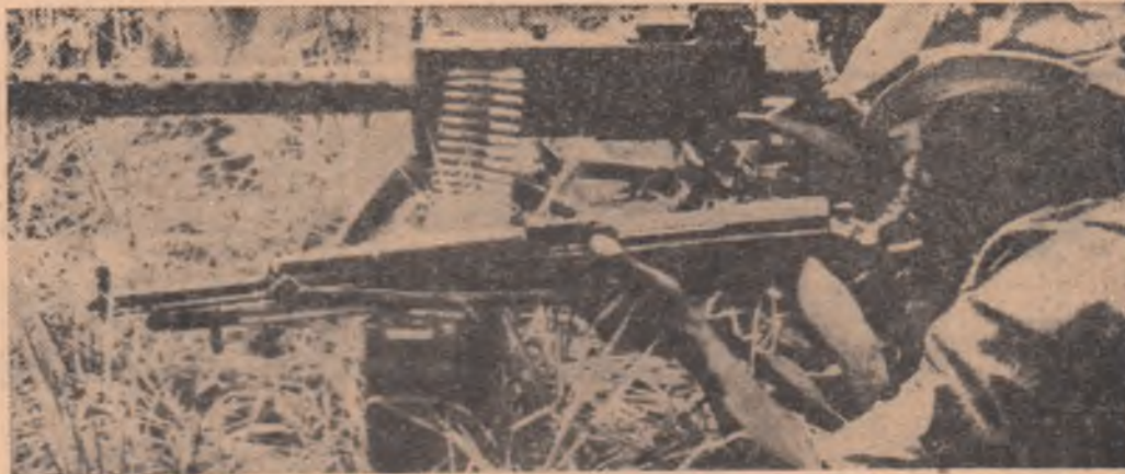
Un detașament al forțelor patriotice din Angola angajat într-o acțiune împotriva coloniștilor portughezi.

La 20 iulie a fost semnat la Dublin un Acord comercial între Republica Socialistă România și Republica Irlanda, primul de acest fel încheiat între cele două țări, transmite corespondentul Agerpres, Nicolae Ploeanu. Acordul care prevede dezvoltarea schimburilor comerciale și a cooperării economice româno-irlandeze, are valabilitate până la 31 decembrie 1972, cu posibilitatea de a fi prelungit în fiecare an.