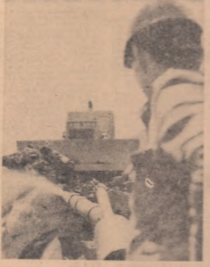
La barajul de pe Lotru se spală sursoarele pentru a nu bună adevare a blocurilor de piatră.

OCTAVIAN MILEA (Continuare în pag. a IV-a)