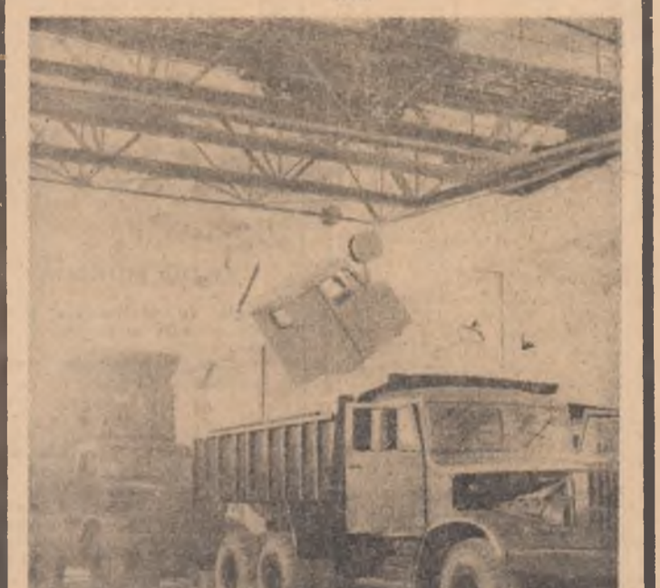
R.P.D. COREANĂ. — Grație înzestrării sale moderne, Uzina de automobile Seungri produce o gamă largă de camioane destinate numeroaselor șantiere de construcții.