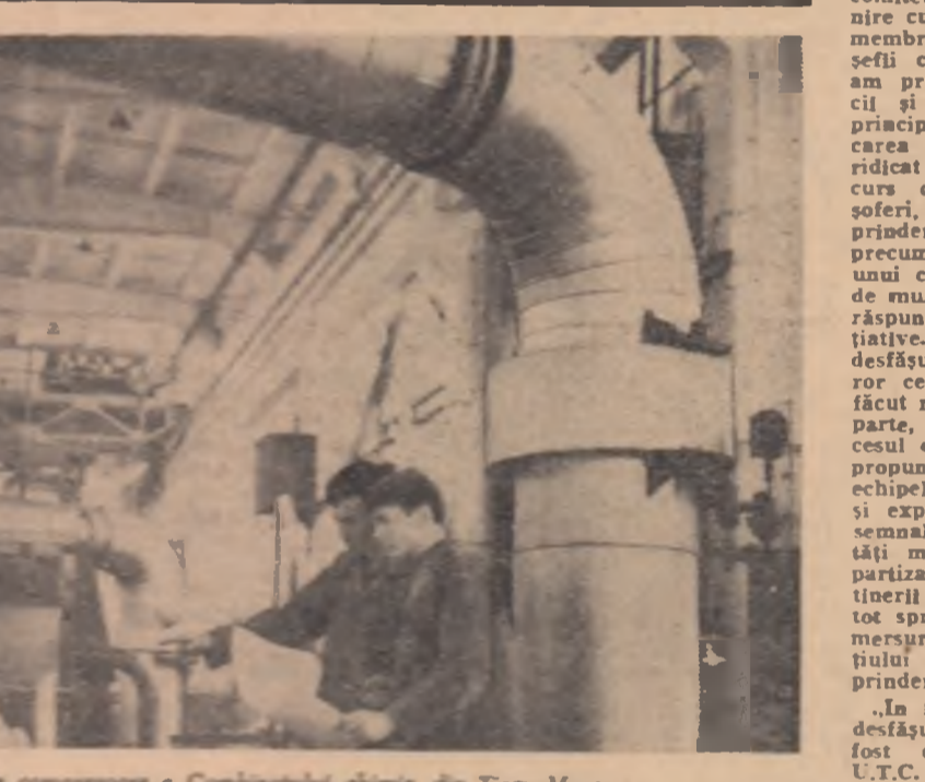
În sergia de compresoare a Combinatului chimic din Tirgu Mureş.

De asemenea, consider un punct cîştigat aprobarea ca pentru cîştigătorii concursurilor pe meserii organizate de noi, să li se acorde trecerea la „excepţional”, reducînd timpul pentru mărirea categoriei de salarizare. Cu acelaşi prilej, s-a recomandat încă o dată tuturor conducătorilor procesului de producţie să participe activ la activităţile de instruire a tinerilor.