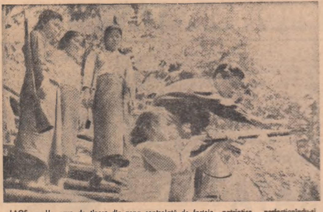
LAOS. — Un grup de tineri din zona controlată de forțele patriotice, perfecționându-și cunoștințele militare.

În cadrul ședinței au luat cuvântul șefii delegațiilor Suediei și Mexicului. Reprezentanta Suediei, Alva Myrdal, a tratat în discursul său problema interzicerii experiențelor nucleare subterane. Ea a prezentat unele sugestii și propuneri concrete referitoare la prevederile unui acord de prohibire a experiențelor subterane cu arma nucleară, care ar trebui să devină obligatorii pentru toate țările în 1969. Alva Myrdal a pledat pentru achiziția neîntreruptă a unui tratat internațional de încetare a experiențelor nucleare în mediu subteran. „Un acord de interzicere a experiențelor nucleare subterane”, a spus vorbitoarea, „ar reprezenta un adevărat realizare importantă. El ar feri omeniara de punerea la punct a unor arme de nimicire în masă și mai dăunătoare”. Ambasadorul Alfonso Garcia Robles a anunțat în calitate de reprezentant al Mexicului, stat depozitar al tratatului privind interzicerea armelor nucleare în America Latină, că, recent, guvernul Olandei a depus la Ciudad de Mexico instrumentele de ratificare a protocolului adițional I al acestui tratat. În acest mod, Olanda devine, după Anglia, a doua țară care ratifică protocolul adițional I al tratatului de la Telatelo, protocol prin care statele ce exercită jurisdicția asupra unor teritorii din zona de aplicabilitate a acestui tratat își asumă obligația de a asigura în aceste teritorii transpunerea în practică a statutului de denuclearizare.