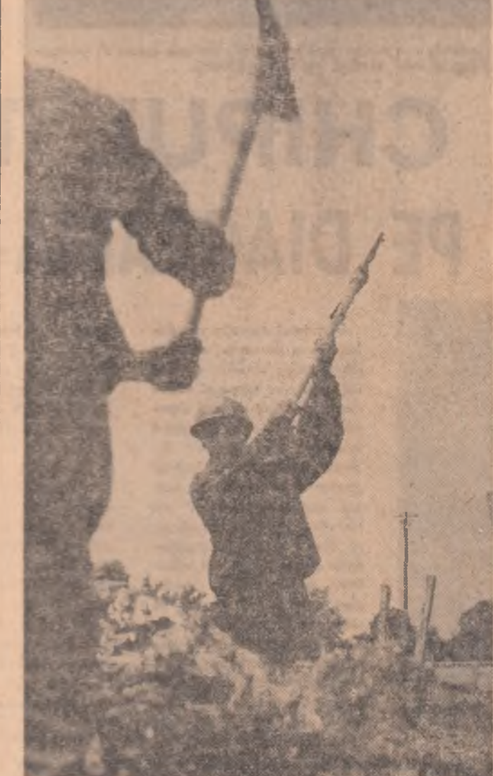
Elvii pe șantierele muncii patriotice la Breaza.

gourilor. Numai astfel putem asigura frontul de lucru continuu colegilor noștri de la linia de laminare. Precuparea laminatorilor și lăcătușilor de la întreținere este îndreptată spre funcționarea con-