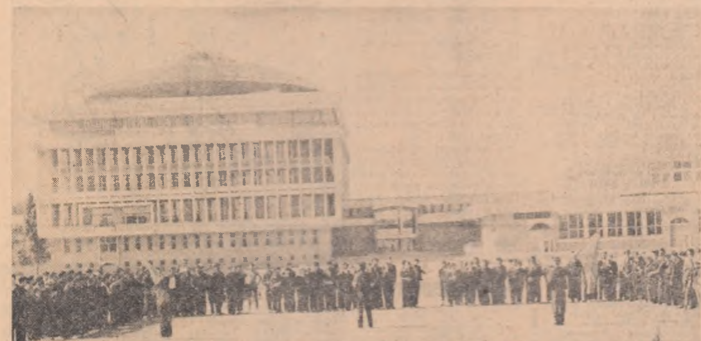
Ieri cei 170 de tineri constituiți în tabăra de la Izvorul Mureșului ca brigadă de muncă patriotică s-au reunit în primul lor concurs, pe șantierul Institutului politehnic din București.

Si cooperatorii, mehanizatorii, inginerii și tehnicienii care lucrează pe ogoarele județelor Prahova și Ialomița au raportat — în telegrama trimisă cu acest prilej tovarășului Nicolae Ceaușescu — încheierea recoltării grîului și orzului, multumind pentru prețioasele indicații primite cu prilejul recentelor vizite de lucru.