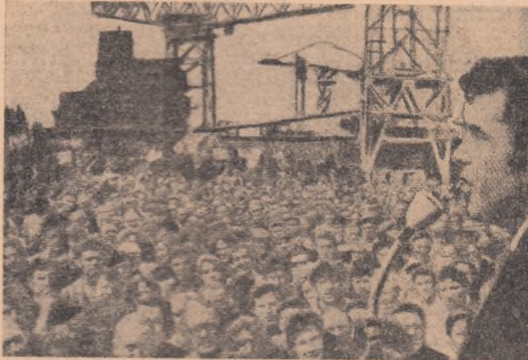
Miting al muncitorilor de la șantierul naval Upper Clyde din Marea Britanie, amenințați de boicotați guvernamentale de concentrare a șantierelor.

Șeful statului sudanez, generalul Gaafar el Numeiry, a procedat marți la o remaniere a guvernului — anunță agenția Reuter, citind agenția M.E.N. Au fost cooptați în guvern o serie de noi miniștri. Printre aceștia se află Mansour Khaled, numit ministru al afacerilor externe. Tot în cadrul remaniei, Abel Allen a fost desemnat ministru pentru problemele sudului, Moussa El Moubarak a devenit ministru al muncii, iar fostul vicepremier, Zein El Abdin Abdel Kader, i s-a încredințat portofoliul comunicațiilor.