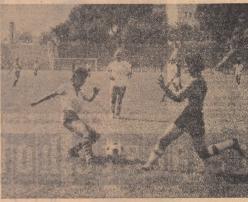
„Mimi, da un gol pentru mine”