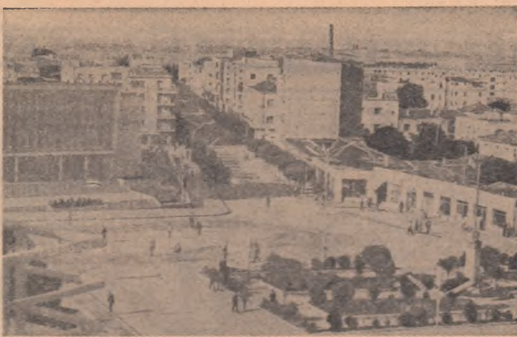
R.P. ALBANIA. — Imagine din orașul Durres.

de 96 km de Belfast, au fost înregistrate mai multe explozii provocate de bombe, unele dintre ele soldându-se cu importante pagube materiale. Pe de altă parte, la Londonderry, poliția a ordonat extremiștilor protestanți să modifice traseul manifestației pe care o organizează pentru ziua de 12 august, spre a aniversa victoria protestanților asupra trupelor catolice care au încercat să atace orașul în anul 1688. Poliția a cerut ca demonstrații să nu treacă prin apropierea cartierului catolic Bogside, spre a se evita noi ciocniri. În același timp, forțele de ordine au fost întărite cu încă 2.000 de militari britanici, care se adaugă celor aproape 10.000, dislocați în Ulster.