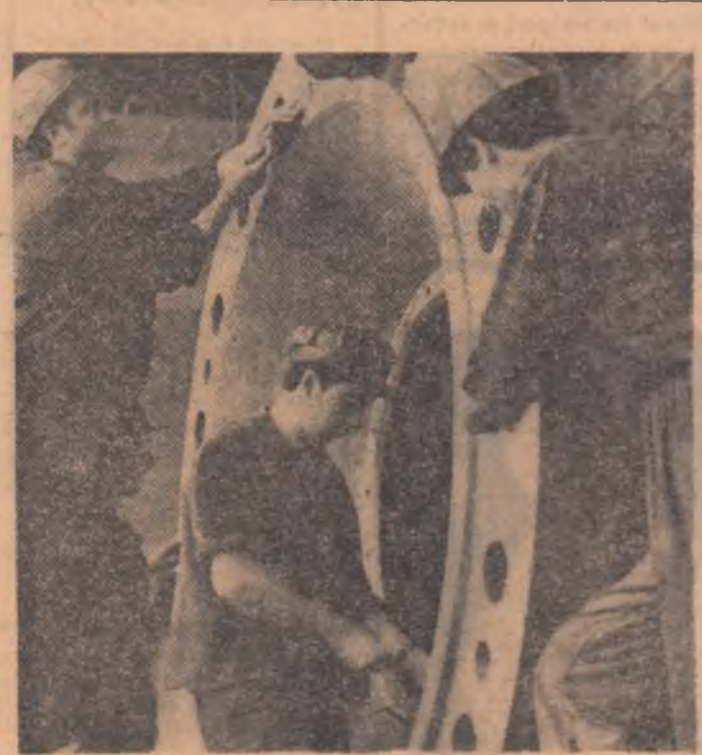
La „Porțile de Fier” echipa de montori pregătește ultima turbină pentru darea în funcțiune

pină cu puțini ani în urmă cu o industrie extrem de săracă —