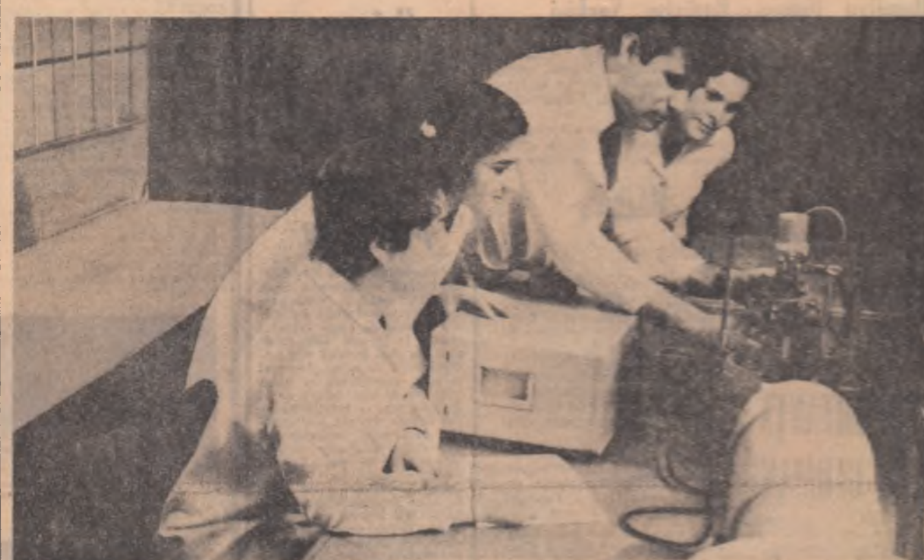
Studeni la o oră de laborator.

INVATAMINTUL SUPERIOR AGRONOMIC, ECONOMIC, UNIVERSITAR, PEDAGOGIC, MEDICAL ȘI ARTISTIC, CURSURI DE ZI ȘI SERALE, AL DOILEA CONCURS DE ADMITERE SE VA ORGANIZA ÎNTRE 5-12 SEPTEMBRIE.