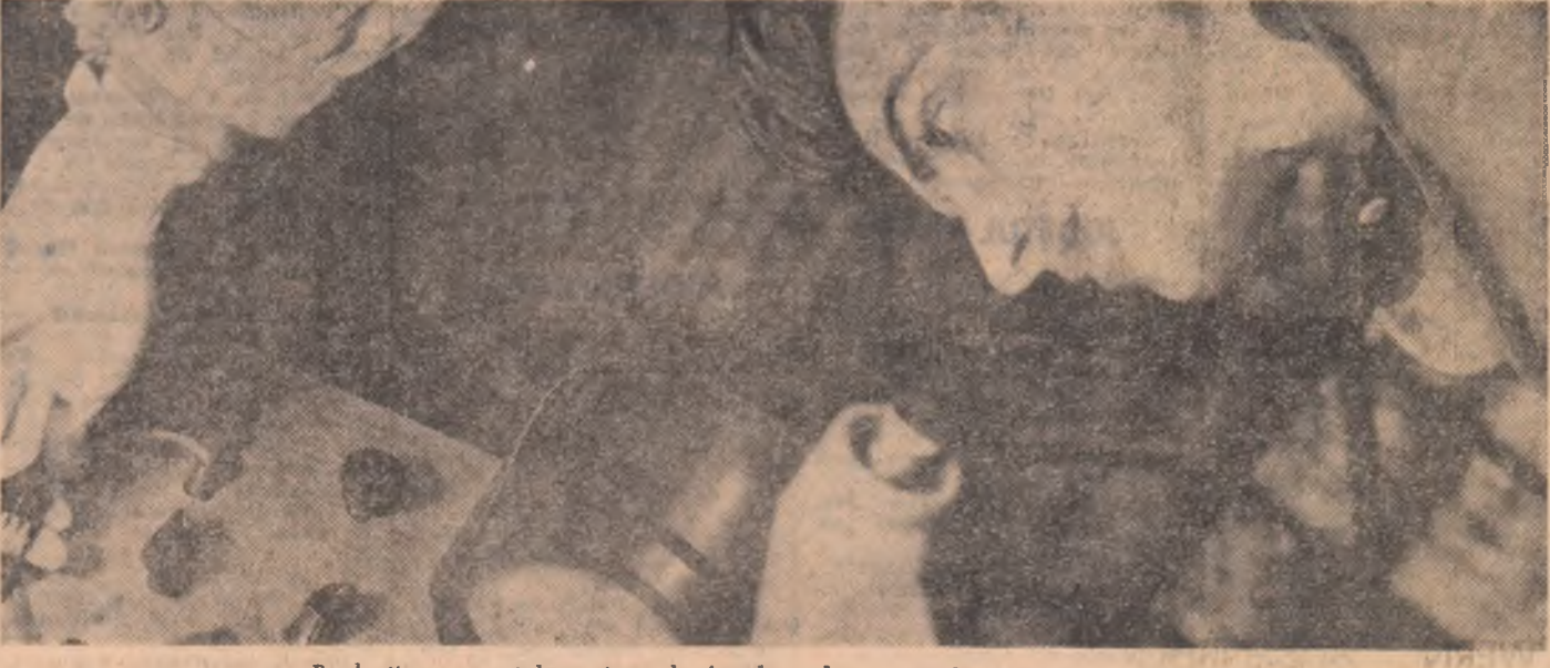
Producția — punctul terminus al efortului tehnico-științific propriu în electronică