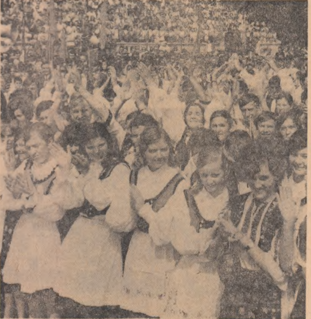
„Strins uniți în jurul partidului nostru iubit, meru alături de dumneavoastră, scumpe tovarășe Ceaușescu”.