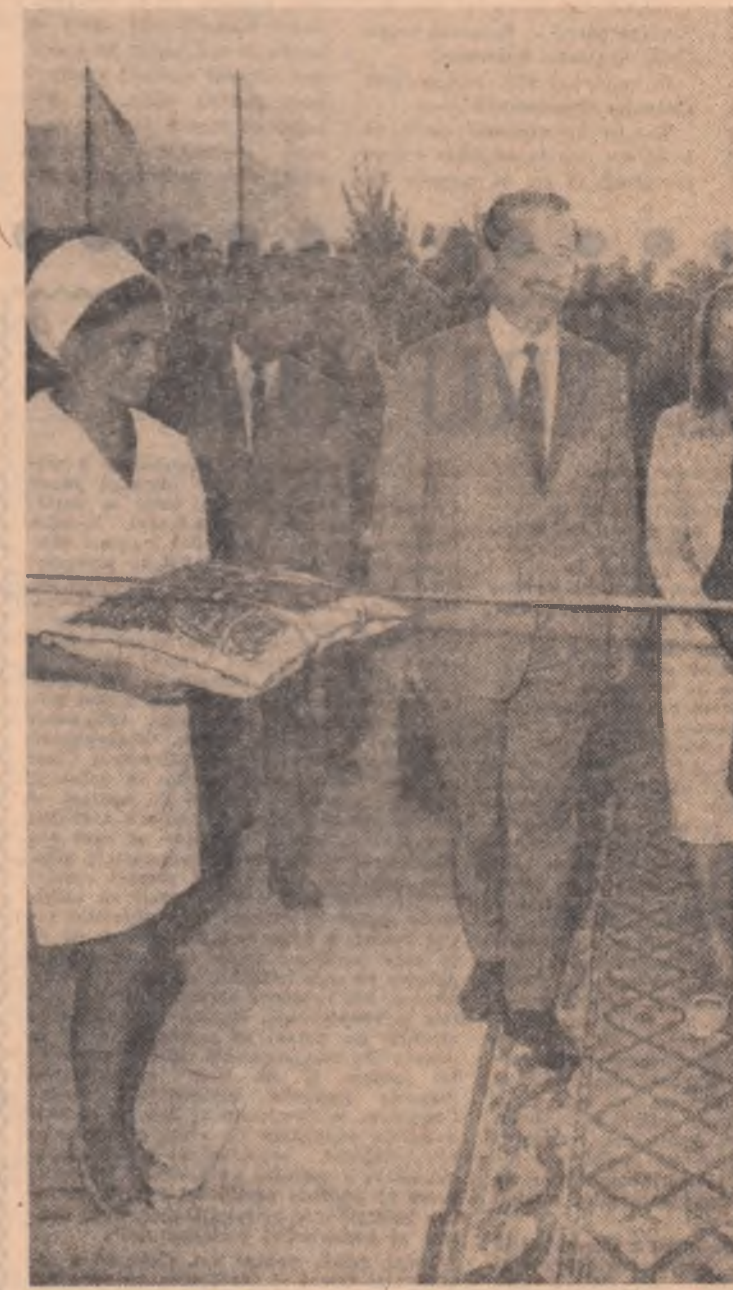
În aplauzele personalului sanitar, ale localnicilor, tovarășul Nicolae Ceaușescu taie panglica inaugurală a noului spital județean din Miercurea Ciuc.

șeful conducătorilor de partid și de stat. Aflînd de vizita secretarului general al partidului, au venit să-l salute aici la Bălan, oștirea zecii de studenți constituită în brigada națională de muncă patriotică, instruită la Izvoarele Mureșului, din apropierea Bălanului. Deși acești studenți aveau să plece a doua zi la Bucur-