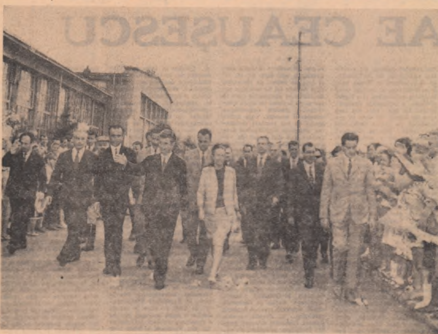
În mijlocul locuitorilor din Cristuru-Seculesc