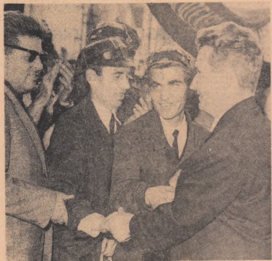
Mineri și studenți aflați la Bălan, împreună au venit să-l întâmpine pe secretarul general al partidului