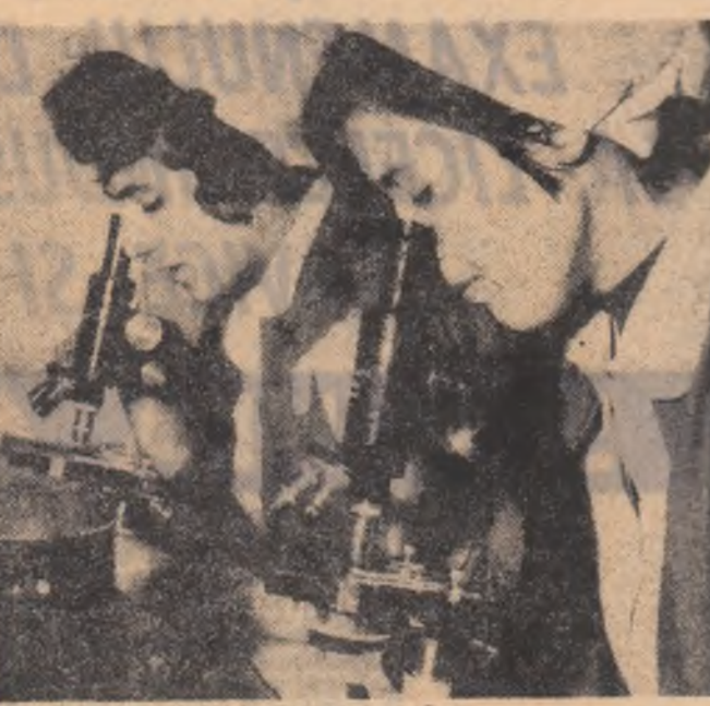
Dezvoltarea economică și culturală a Iranului a deschis noi perspective femeilor. Fotografia noastră înfățișează tinere iranienne într-un laborator de cercetări din Teheran