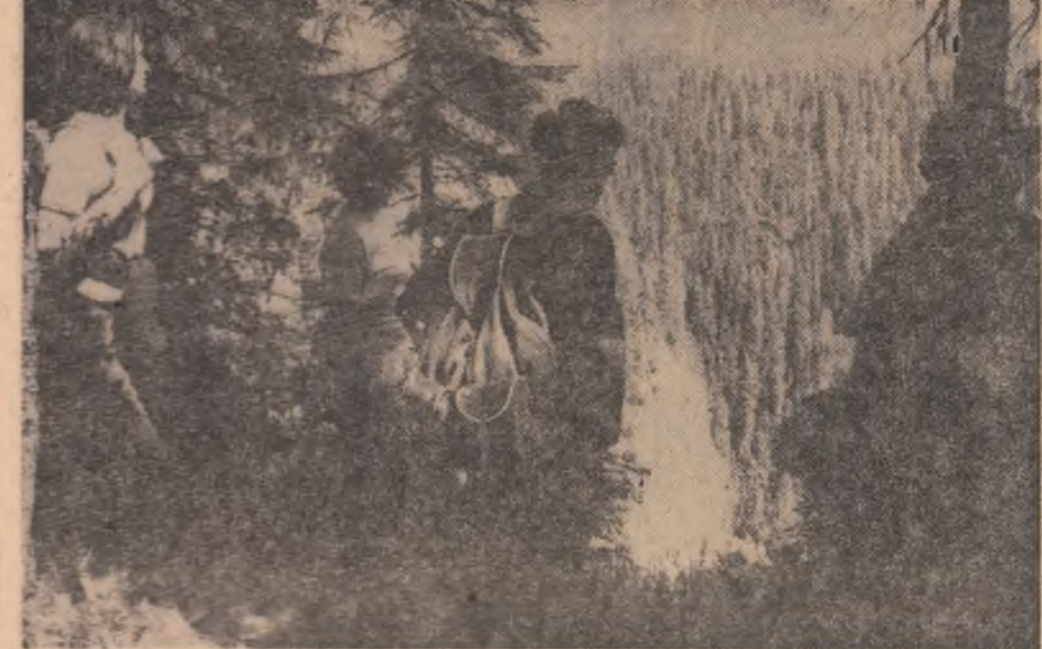
Prin munții Apuseni

Poate cu o tentă de asemănare cu manifestările organizate pe muntele Găina, această sărbătoare s-a desfășurat în marele amfiteatru natural al Durăului, din inima Ceahlăului. Manifestările au început cu o seară înainte și, pînă noaptea târziu, focurile aprinse vesteau că aici la poalele Ceahlăului au poposit mii de localnici, turiști din țară și străinătate. O dată cu răsaritul soarelui a avut loc deschiderea festivă, după care a urmat o autentică paradă a cîntecului, jocului și portului popular, a obiceiurilor și tradițiilor statornicite din străbuni. S-au desfășurat apoi, în minutul decor natural, o serie de manifestări distractive și sportive, însă farmecul sărbătorii l-a constituit programul cultural-artistic, cu un repertoriu bine întocmit. S-au dat înălțare formațiile de dansuri și corul din Ceahlău, corul din Hanșu, echipa de dansuri de la Poiana Teului, fluităreții și dansatorii din Borca (care în această toamnă vor evolua la Zakopane, în cadrul concursului internațional de folclor). Pe scena Durăului și-au etalat calitățile artistice și