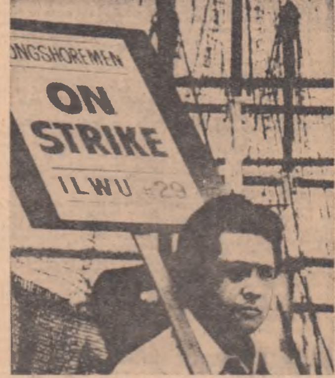
S.U.A. — Aspect din timpul grevei docherilor din 24 de porturi de pe litoralul vestic

Măsurile anunțate de președintele Nixon au fost discutate marți, într-o ședință urgentă, de cabinetul japonez. După ce sînt, purtătorul de cuvînt al cabinetului a declarat că guvernul nipon nu va renunța la politica de a menține actuala paritate a Yenului. În schimb, el va acționa în direcția îmbunătățirii programului de politică economică pentru a face față presiunilor externe. Întrucît economia ni-