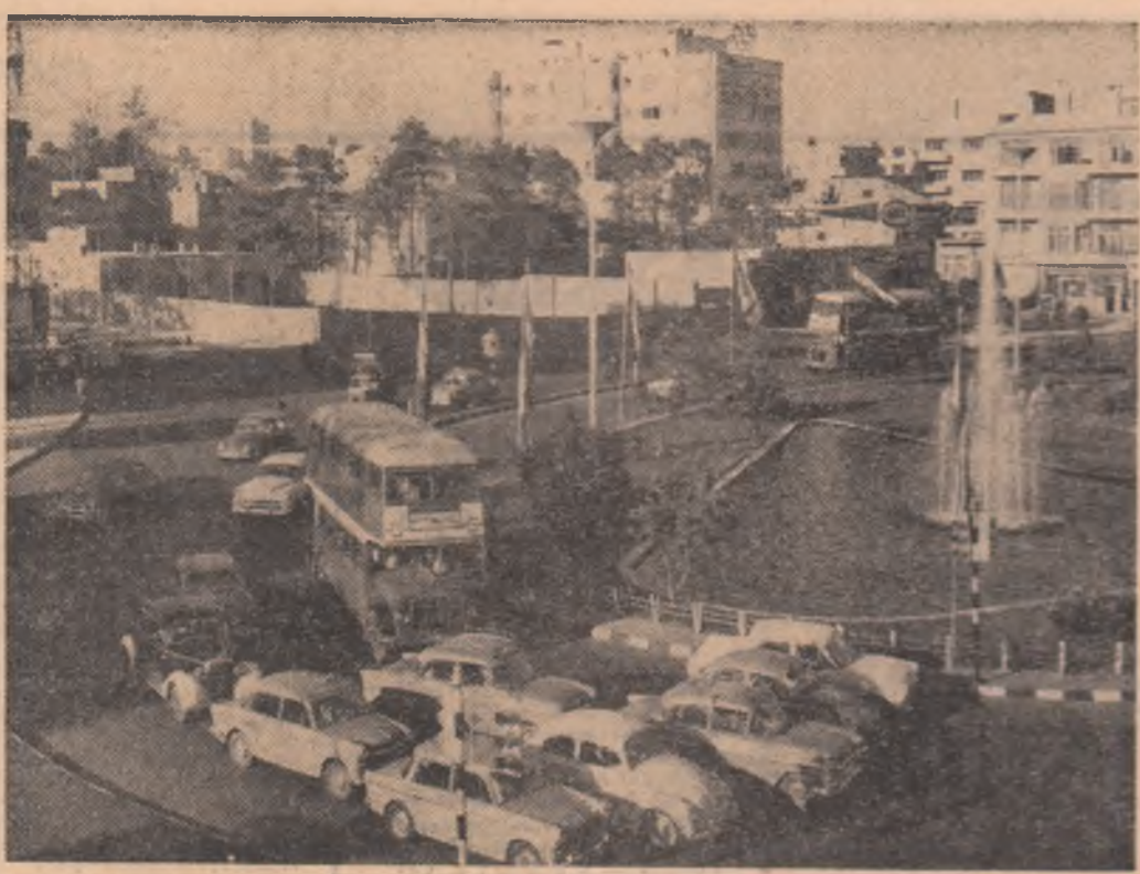
IRAN. — Imagine din Teheran

Multora mecanismele financiare li se par extrem de complicate, un domeniu rezervat doar experților. Dar dincolo de formulele mai greu înțeleșibile de către neinițiatii, dincolo de explicațiile mai mult sau mai puțin savante, se ascund realități care pot da răspuns numeroaselor întrebări privind soarta dolarului. Causa esențială a dificultăților economice americane rezidă în imensele cheltuieli