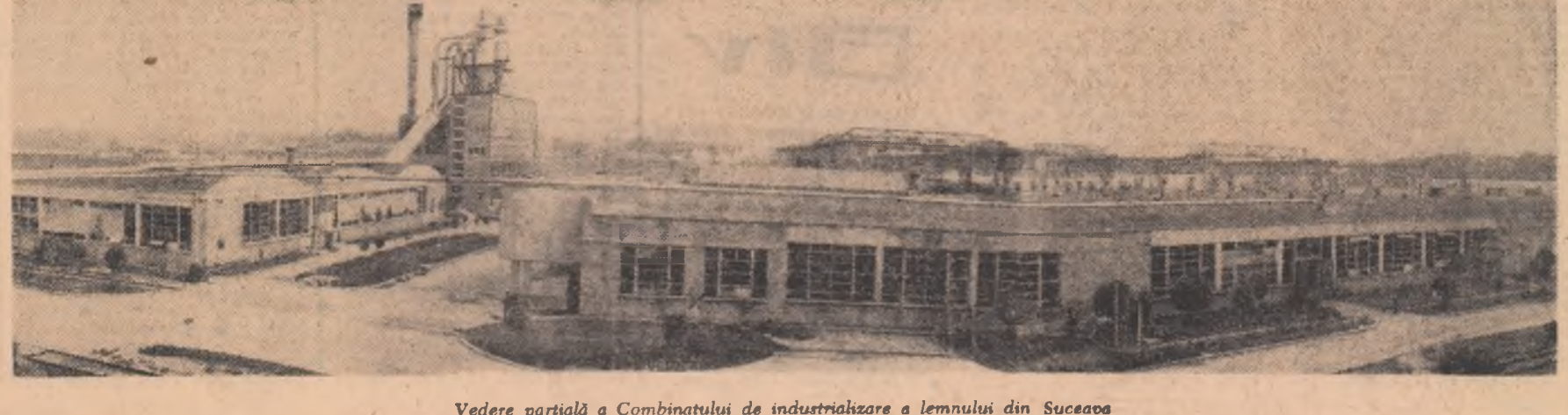
Vedere parțială a Combinatului de industrializare a lemnului din Suceava