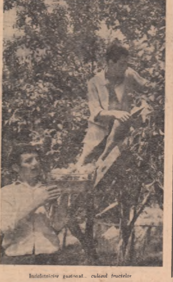
Încheierea gastronomică... culesul fructelor

Pămîntul rămîne în nemurire simbolul dragostei noastre, al iubirii noastre de neom, fantastică noastră legătură cu cei ce-au fost și cu cei ce vor veni. Acolo, departe, unde bătrânul se luptește în ape, iar copetele vocalele pămîntului, sufletul meu se împletește cu cuvîntul viu — acolo, nopțile mele de lucru le simt ca pe nopți ale fîgăduinței.