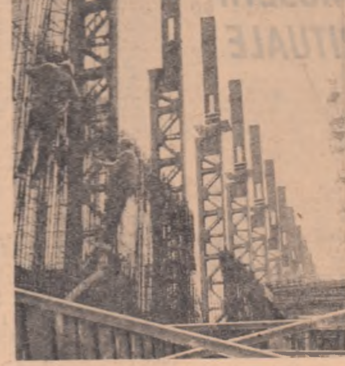
U.R.S.S. — Combinatul metalurgic „Ordjonikidze”.

TRIPOLI. Un partener de curvie al guvernului de la Tripoli a dezmintit afirmațiile autorităților de la Fort Lamu potrivit cărora Libia ar fi fost implicată în tentativa de lovitură de stat care a avut loc în Ciad, la sfârșitul săptămânii trecute — anunță agenția libiană de presă. În legătură cu aceasta, se reaminteste că, după dejacarea tentativei de lovitură de stat, Ciadul și-a anunțat întreruperea de rupe relațiile diplomatice cu Libia. Ministrul de externe al Republicii Democratice Populare a Yemenului, Mohammed Saleh Aliquii, a sosit luni într-o vizită la Cairo — anunță agenția M.E.N. El a declarat că va lăsa șeful statului egiptean, Anwar Sadat, un mesaj din partea președintelui Consiliului Prezidențial al R.D.P. a