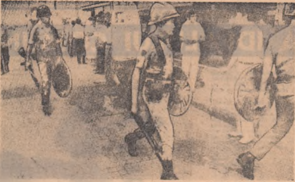
Pe străzile Saigonului patrulăază soldații în solda regimului Thieu. Cum data farsei electorale se apropie, unicul candidat la președinție, Thieu, se pune la adăpostul armelor pentru a fi sigur că-și va prelungi mandatul.