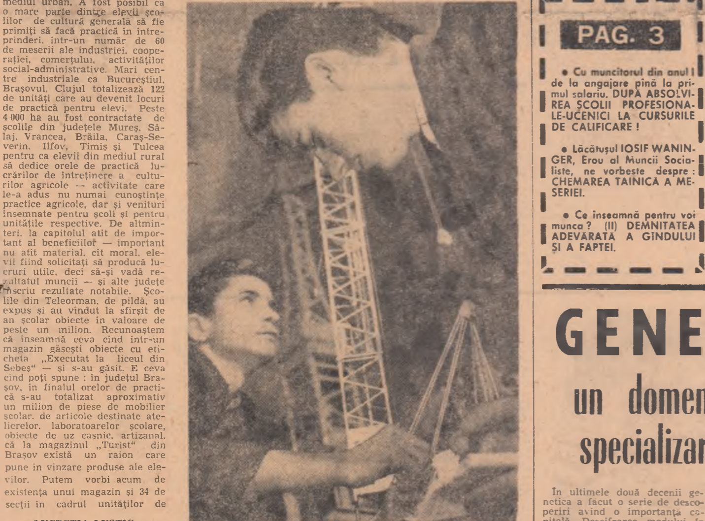
Imagina obișnuită într-un atelier școlar.

De îndată ce traversezi ulița Lipsicanilor — este notat într-o cronică a Bucureștiului — acum aproape un veac — te găsești deodată în inima unui adevărat bazar oriental: furnicar de lumce nu nu conține o clipă, noian de glasure, puzierile de măruri de toate cete, aşezate pe tarabe joase, sprijinite de zădărnice roșietice sau galbene, agățate pretutindeni”. Astăzi locul vechilor duhane, al fatadelor patinate de vreme este luat, pe baza unei excelente inițiative a Consiliului popular municipal, de unități moderne, cu vitrine largi, geometrice, și firme de neon. Magazine cu specific, bazaruri, artizanate pe Selari, Blăniari sau Gabroveni, consignații — pe Covaci. Un pitoresc modern, dublat de o serioasă funcționalitate economică, comercială. Cetățenii au posibilitatea să achiziționeze aici mărfuri dintr-o gamă mai variată și, în același timp, (prin intermediul unităților „Consignația”) să vândă — într-un cadru civilizată — ceea ce le prisosește. Profund de traficul comercial intens și-au făcut însă apariția și o serie de afaceriști, vinători de chilipiruri, colportori anacronici ai unor metehne orientale demne de dispreț. Sint, în general, indivizi care nu muncesc și, din speculă, (cumpărând și revinzând apoi cu suprapreț diver-