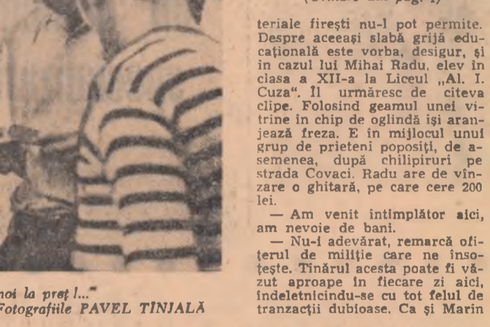
„Ne înțelegem noi la proză!...“