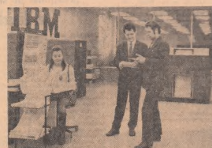
Aspect din Centrul de calcul al Universității București, unde își perfecționează pregătirea profesională citorii matematicieni, fizicienii și ciberneticienii.

Dar, pentru că ne referim la studiul și la documentare trebuie să spunem că, azi, creșterea exponențială a numărului de publicații internaționale de știință și tehnologie este pe cale să provoace o situație haotică. În prezent există circa 35.000 reviste în care se publică peste 2.000.000 articole anual în aproape 50 de limbi. Este probabil ca peste 50 de ani omul de știință să aibă 8.000.000 de coli care vor publica în 350.000 de reviste. Un studiu al UNESCO, a arătat că un sistem mondial de informare științifică, bazat pe calculatoare este nu numai necesar în aceste condiții dar și realizabil. Astfel s-a născut proiectul UNISIST (United Nations Information System) pe care UNESCO a încercat să-l pună în viitorii ani pe picioare, un proiect ce are ca scop facilitarea informației și crearea de baze științifice și tehnologice. Dar să-l dăm cuvîntul: prof. AUGUSTO FORTI: