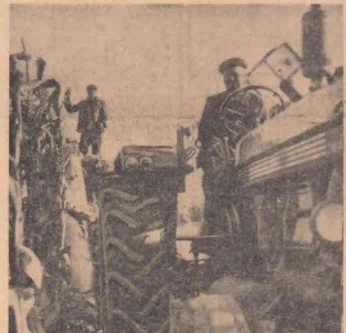
Alături de culegători, în lanurile de porumb au intrat și combinele

● Angajament ferm: în 30 de zile recolta județului Constanța va fi în hambare! ● Mii de elevi — un puternic și activ detașament ● „Nici un tînr în afara formațiilor de lucru” ● La Dunărea, brigăzile de muncă ale tinerilor se ajută între ele ● Fiecare tînr din întreprinderile și instituțiile județului Constanța va recolta porumbul de pe o jumătate de hectar.