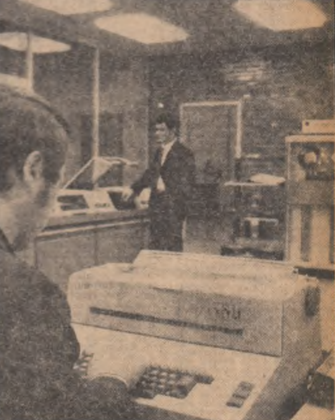
Se caută soluțiile optime ale unei probleme complexe a cărei rezolvare beneficiază de aportul calculatoarelor.

Pria formularea aprecierilor, asistenții îndrumători de grupă introduc în memoria cal-