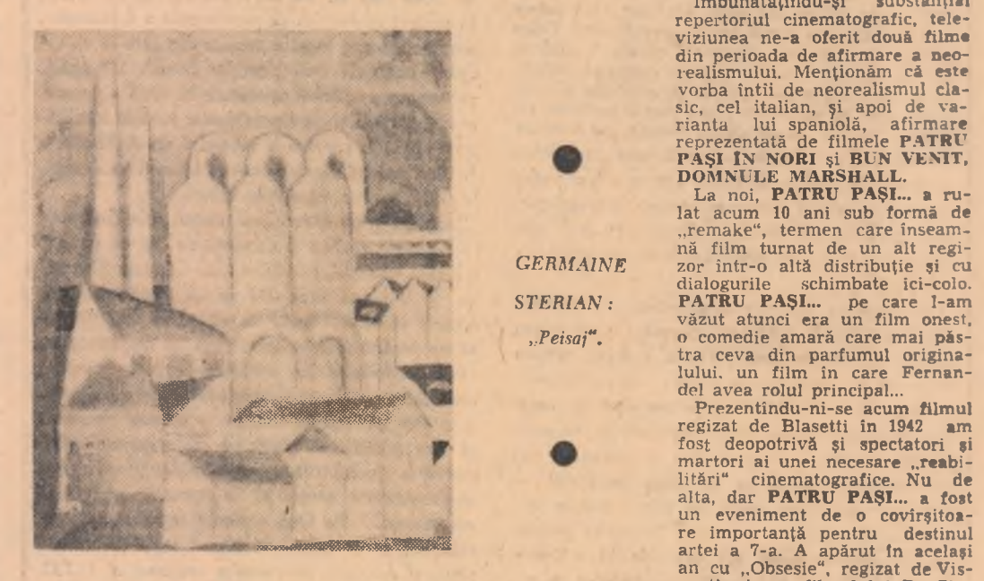
GERMAINE STERIAN: „Peisaj”.