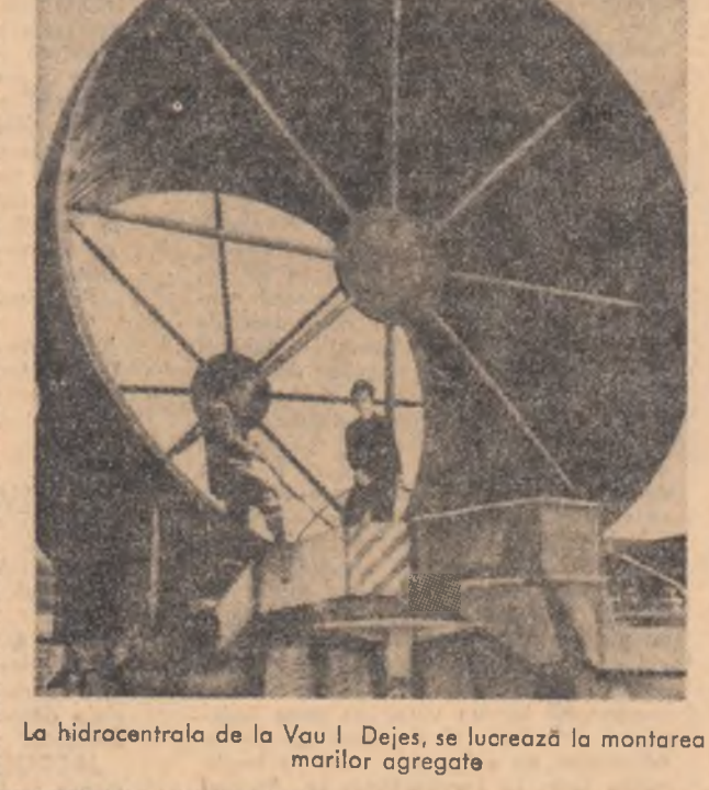
La hidrocentrala de la Vau i Dejës, se lucrează la montarea marilor agregate

anuală medie de 6 miliarde kWh. Albania socialistă valorifică, astfel, marea bogăție a resurselor sale potențiale hidroenergetice.