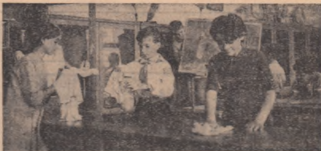
Școala generală nr. 56. De aici a pornit chemarea către toți pionierii țării. Au răspuns marelui din Capitală 170 de școli

Transcriem în PAG. A III-a răspunsurile primite.