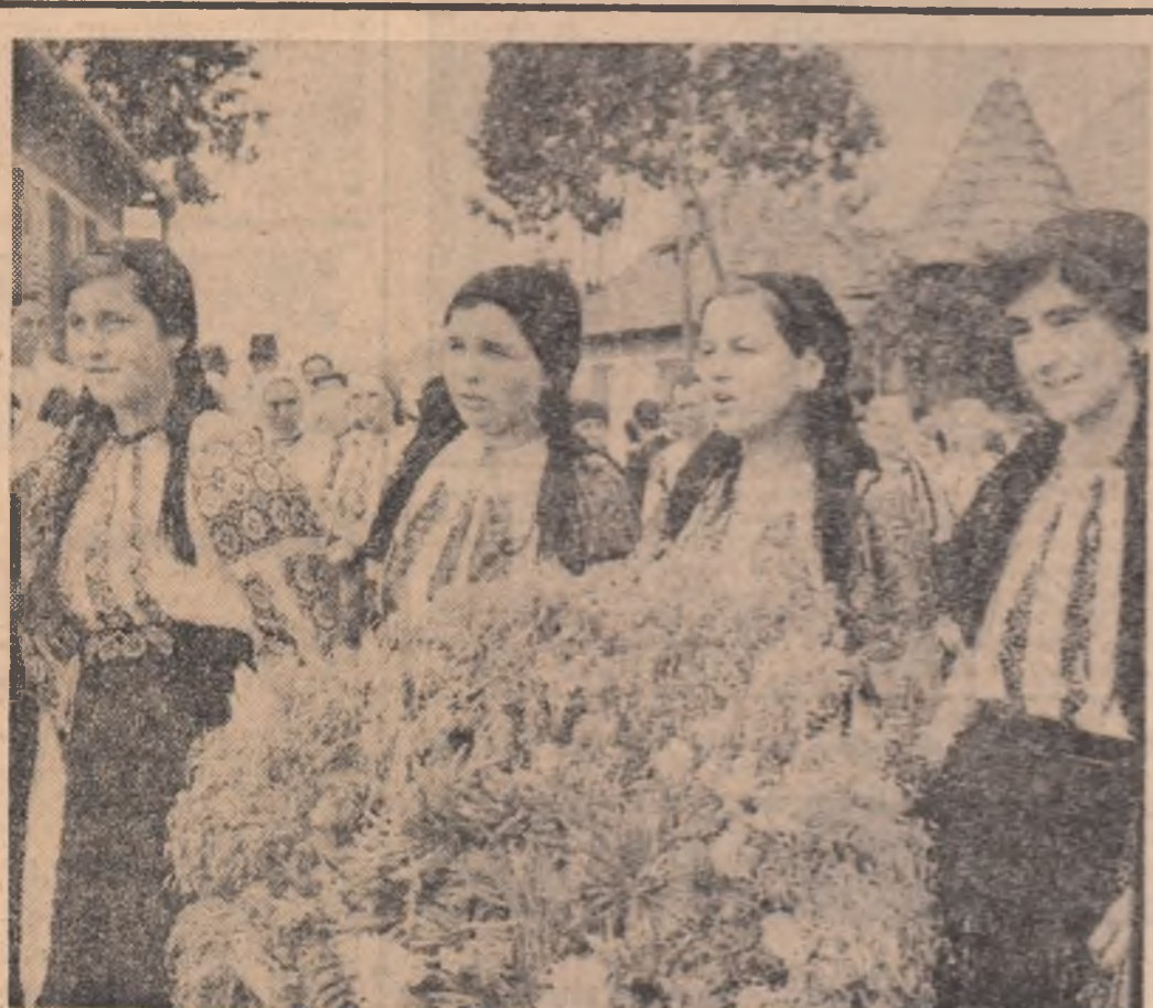
„Cîntecul cununei” în comuna Solovăstru — Mureș, eveniment sărbătoreț care marchează încheierea recoltării grîului

Convorbire consemnată de AL. DOBRE (Continuare în pag. a IV-a)