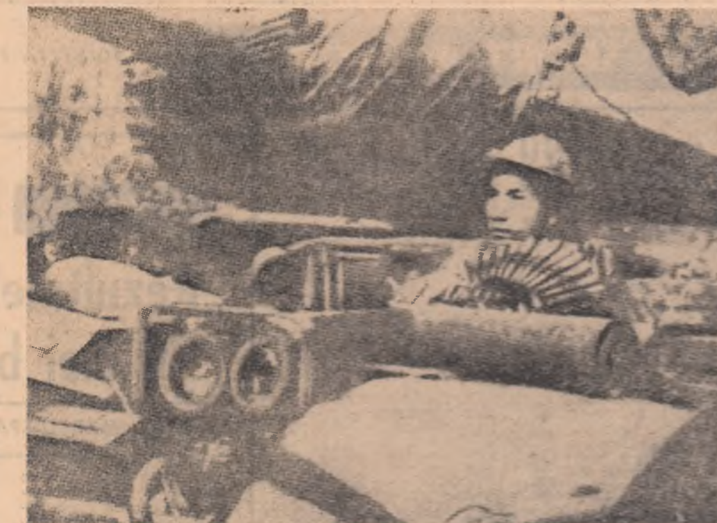
VIETNAMUL DE SUD. — Un luptător al forțelor patriotice folosește în cursul unui atac un tanț capturat de la forțele intervenționiste americane

Pancarta, sugestivă, este o chemare, un imbold în marea campanie de alfabetizare organizată actualmente în Columbia, cu scopul de a lichida ceea ce autoritățile denumesc „o rușine de neșuportat”. În fapt, circa un sfert din populația de 20 de milioane a Columbiei nu știe să scrie și să citească. Acțunea de alfabetizare