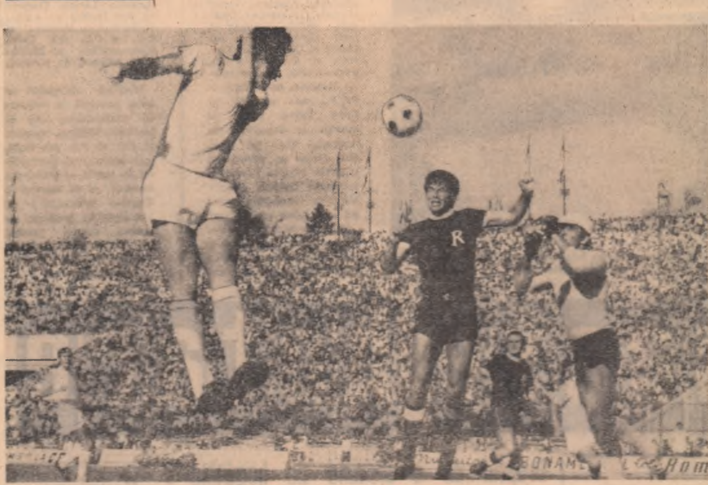
Fază din meciul Rapid-Dinamo