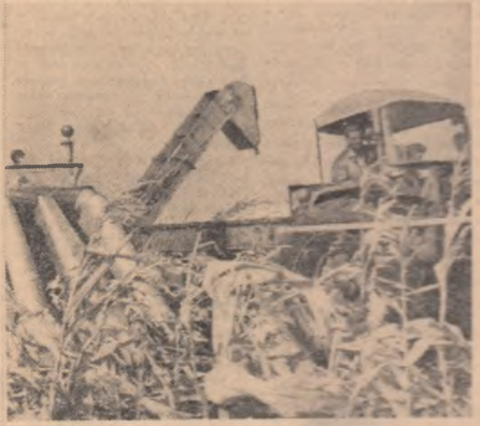
O imagine surprinsă în cîmp: recoltarea porumbului

ORGAN CENTRAL AL UNIUNII TINERETULUI COMUNIST ANUL XXVII, SERIA II, nr. 6943 | 4 PAGINI — 30 BANI | LUNI 13 SEPTEMBRIE 1971