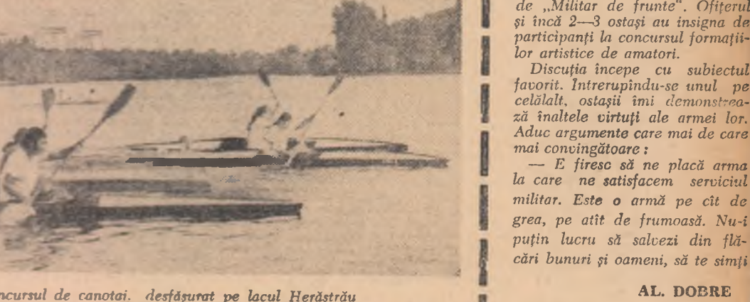
Imagine de la Concursul de canotaj, desfășurat pe lacul Herăstrău

Discuția începe cu subiectul favorit. Intrerupîndu-se unul pe celălalt, ostașii își demonstrează înaltele virtuți ale armei lor. Aduc argumente care mai de care mai convingătoare: — E firesc să ne placă arma la care ne satisfacem serviciul militar. Este o armă pe cît de grea, pe atît de frumoasă. Nu-i puțin lucru să salvezi din flăcări bunuri și oameni, să te simți