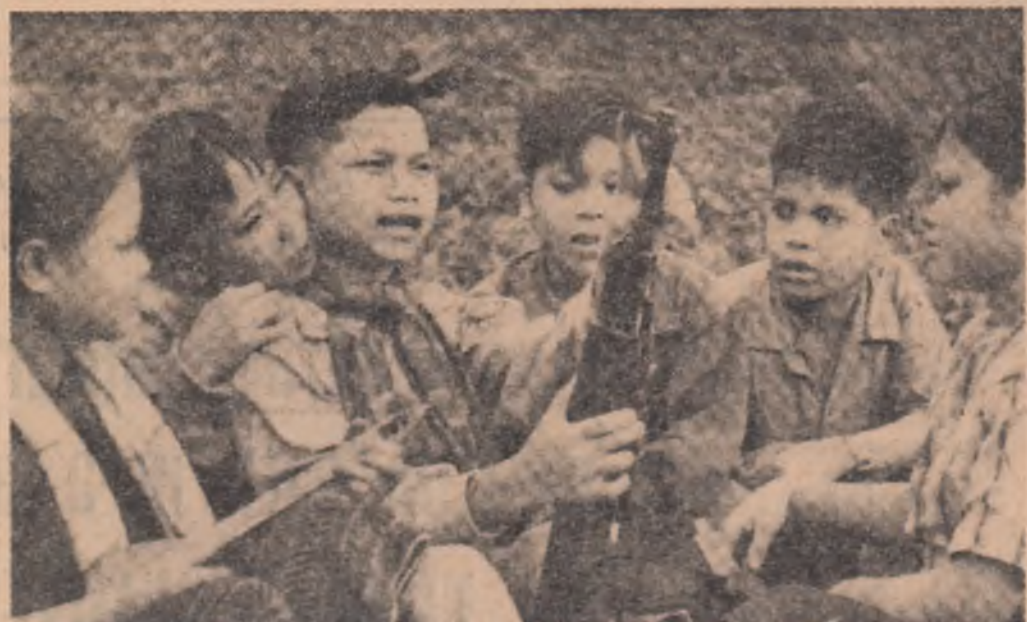
VIETNAMUL DE SUD. — Un grup de tineri patrioți perfecționându-și cunoștințele militare

La Palatul Națiunilor din Geneva s-au încheiat joi după-amiază lucrările celei de-a patra conferințe internaționale asupra folosirii energiei atomice în scopuri pașnice. În timpul de 10 zile aproximativ 900 de participanți — delegați observatori — din 79 de țări s-au reunit în cadrul 10 sesiuni generale și a numeroase sesiuni tehnice o curiozitate trecere în revistă a progreselor înregistrate în toate domeniile folosirii în scopuri pașnice a energiei atomice în ceea ce a urmat celei de-a șaptea conferințe, desfășurată în 1964. În cadrul sesiunii de încheiere a lucrărilor conferinței, care a avut loc în cadrul prezidiului Academiei de Științe a U.R.S.S., a prezentat în raport de sinteză a activităților conferinței. În cadrul aceleiași sesiuni au luat de asemenea cuvântul Guy Bresson, reprezentantul special al secretarului general al O.N.U., dr. Sigvard Eklund, directorul