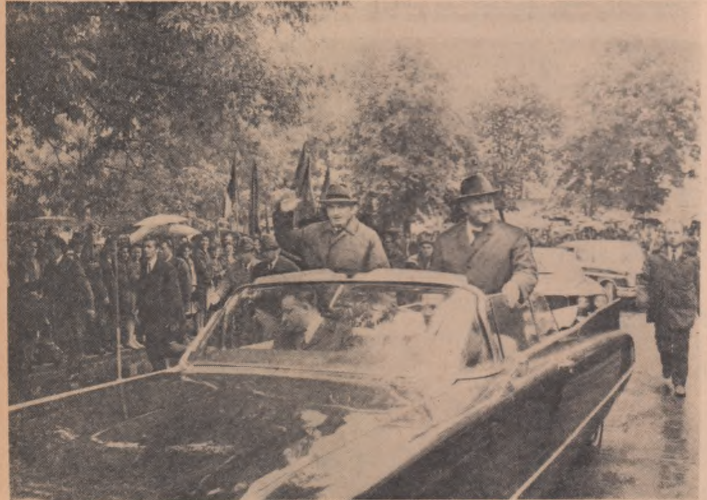
Severinenii fac secretarului general al partidului o entuziastă și călduroasă primire