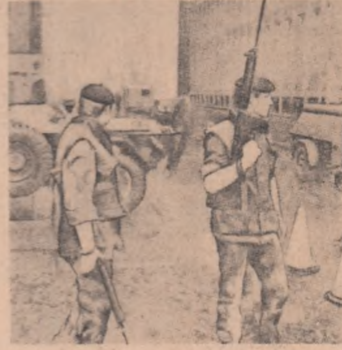
IRLANDA DE NORD. — Militari britanici la Belfast în timpul unei percheziții pe una din arterele de circulație