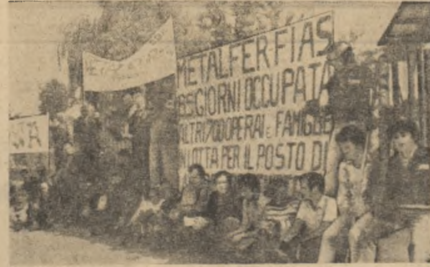
În Italia au avut loc recent greve ale muncitorilor metalurgiști în cadrul cărora participanții au revendicat sporirea salariilor și condiții mai bune de muncă. În fotografie, muncitori de la Metalfer, care au ocupat în timpul grevei sediul întreprinderii.

REDAȚIA ȘI ADMINISTRAȚIA: București, Piața „Științei”, Tel. 17.80.10, 17.80.26. Abonamentele se fac la oficiile poștale și difuzorii din întreprinderi și instituții.