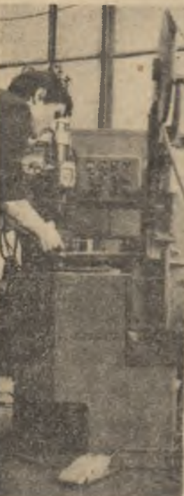
Un tînar ca alții alții, aplecat asupra mașinii la care lucrează, este o imagine care vorbește de la sine.

ANUL XXVII, SERIA II, nr. 6965 4 PAGINI — 30 BANI VINERI 8 OCTOMBRIE 1971