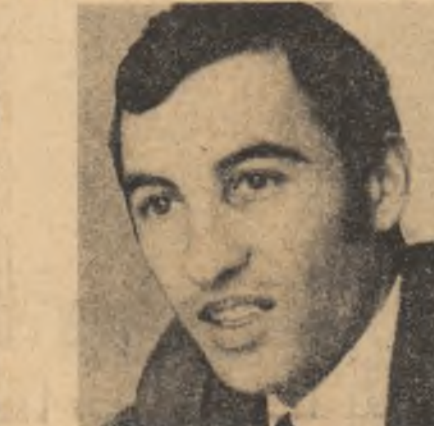
ILIE ORZEA, jurist