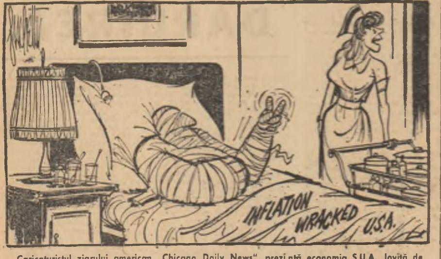
Caricaturistul ziarului american „Chicago Daily News”, prezintă economia S.U.A., lovită de inflație, ca pe un om bolnav, imobilizat la pat, dezrădăduit

18 MILITARI saigonezi au fost uciși, iar alți 7 grav răniți, ca urmare a unui bombardament efectuat din greșală de un avion aparținînd forțelor aeriene ale S.U.A., pe o șosea situată la 95 de kilometri nord-est de Saigon, în apropierea frontierei cambodgiene — anunță agenția Associated Press.