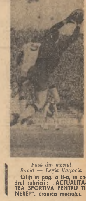
Fază din meciul Rapid — Legia Varșovia. Cîștig în pag. a II-a, în cadrul rubricii „ACTUALITATEA SPORTIVĂ PENTRU TINERET”, cronica meciului.