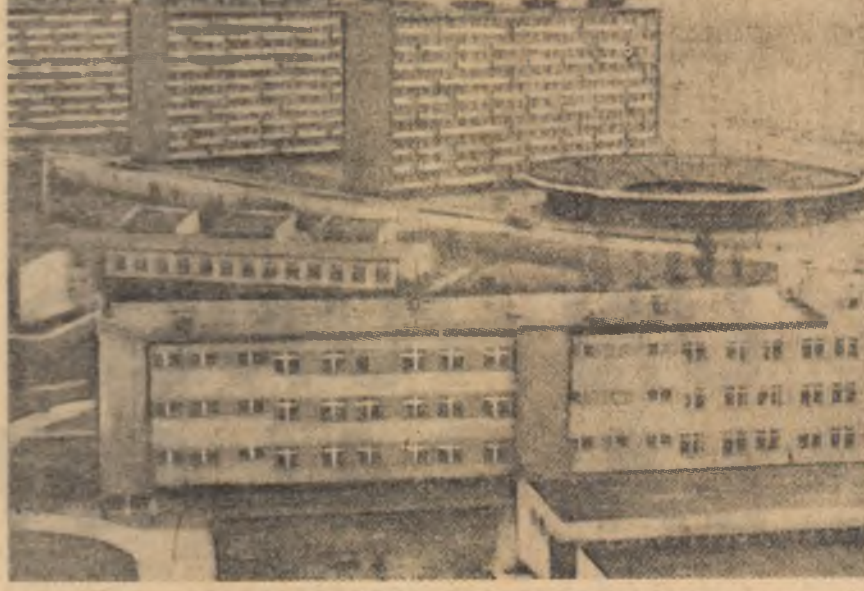
R. P. POLONA. — Noi blocuri de locuințe la Lodz

Comitetul pentru problemele sociale și umantare al Adunării Generale a O.N.U. a adoptat în unanimitate un proiect de rezoluție inițiat de România, careva i s-a susținut că în dezbaterile de azi se discută despre drepturile legitime ale Chinei populare. Or, declarația asupra principiilor de drept internațional privind relațiile prietenești și de cooperare între state”, adoptată la sesiunea jubiliară a Organizației Națiunilor Unite — proiectul — a fost un act de bună credință și nu un act de război, așa cum se arată în declarația internă ale acestui stat. Reprezentantul permanent al Pakistanului la O.N.U., Agha Shahid, a subliniat că evoluția spre restabilirea drepturilor legitime ale Chinei populare la O.N.U. este un fapt inevitabil. Reamintind că rezoluția adoptată de S.U.A. reprezintă un evident fapt al apăsătoare politicii a „celor două Chine” constituie un atentat la adresa integrității teritoriale a Republicii Populare Chineze. Ministrul afacerilor externe al Nigeriei, O. Arkojo, a adoptat în unanimitate un proiect de rezoluție inițiat de România, careva i s-a susținut că în dezbaterile de azi se discută despre drepturile legitime ale Chinei populare. Or, declarația asupra principiilor de drept internațional privind relațiile prietenești și de cooperare între state”, adoptată la sesiunea jubiliară a Organizației Națiunilor Unite — proiectul — a fost un act de bună credință și nu un act de război, așa cum se arată în declarația internă ale acestui stat.