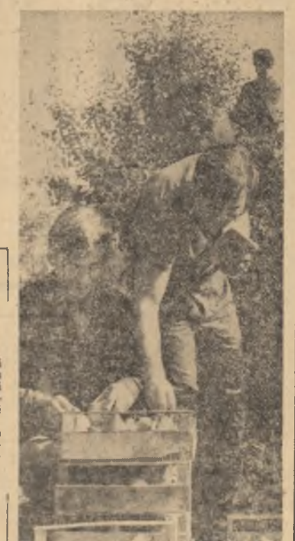
Studentii de la Institutul de Agronomie din București și Institutul pedagogic din Constanța sortind struguri la Oțroe