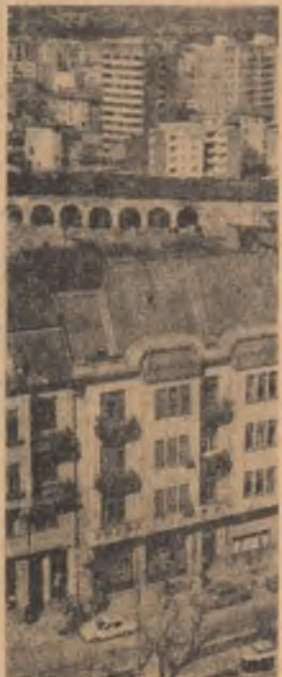
Imagine din Timișoara