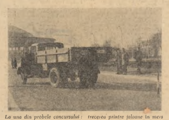
La una din probele concursului: trecerea printre jaloane în mers înapoi.