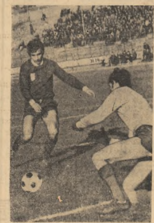
Fază din meciul Rapid—Jiu