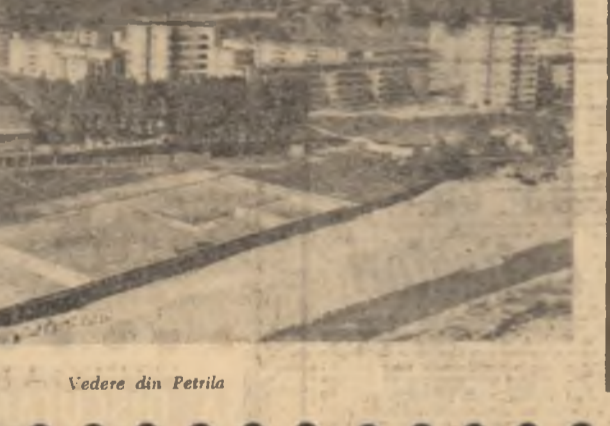
Vedere din Petritia