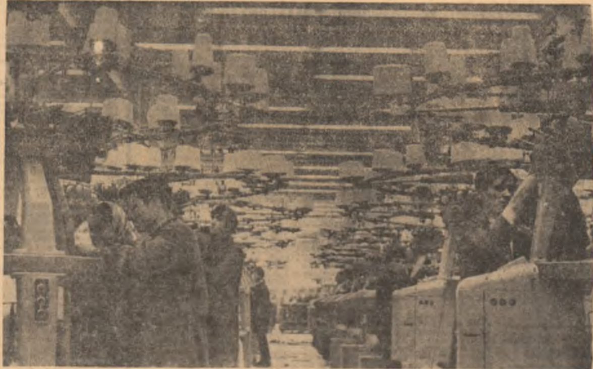
Profiluri profesionale noi

Recent, la Suceava a fost inaugurată expoziția „Mîini de aur” oglîndind primul bilanț al muncii productive a elevilor suceveni. Cuprinzînd 4.000 de exponate trimise din aproape 200 ateliere școlare, expoziția își merită denumirea. Mîinile acestea de aur demonstrează că elevilor le place să-și însușească meseriile județului lor, că pe li-