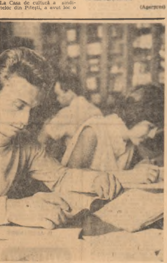
La Biblioteca universitară...

„Si încă adăugăm la această „marcă” (n.r. — distribuția) și dialogul atî de spiritual încît francezii îl pot învidia, ne-am declarat satisfăcuți!”