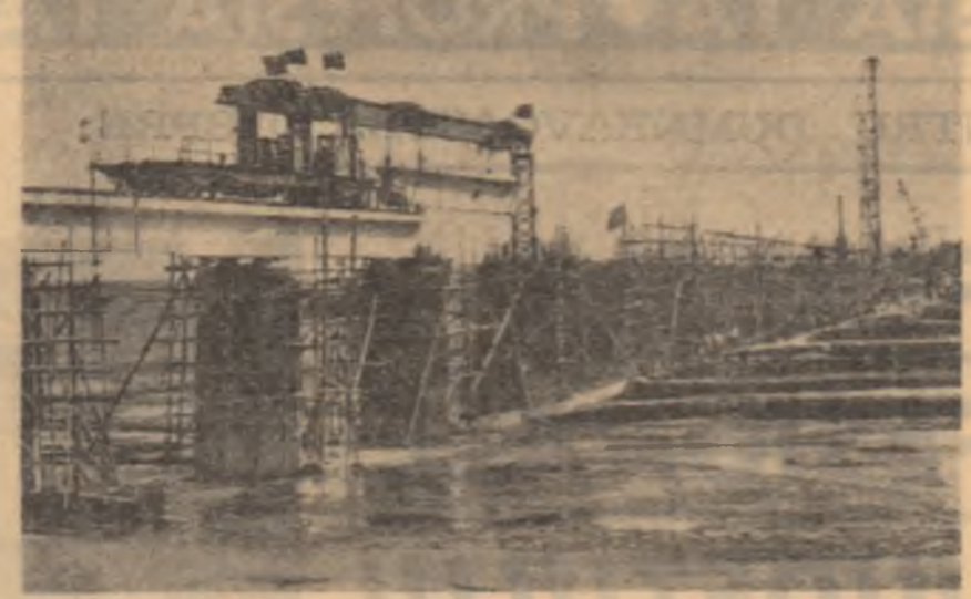
R.P. CHINEZA. — Imaginea a șantierului nouului pod de la Yangtzechiao.

Totodată, acțiunile de protest ale opiniei publice și interdicțiile instituite de autoritățile belgiene l-au forțat pe liderul mișcării neofasciste din Italia, Giorgio Almirante, să renunțe la vizita pe care urma să o facă la Bruxelles pentru a asista la diverse întruniri de extremă dreaptă.