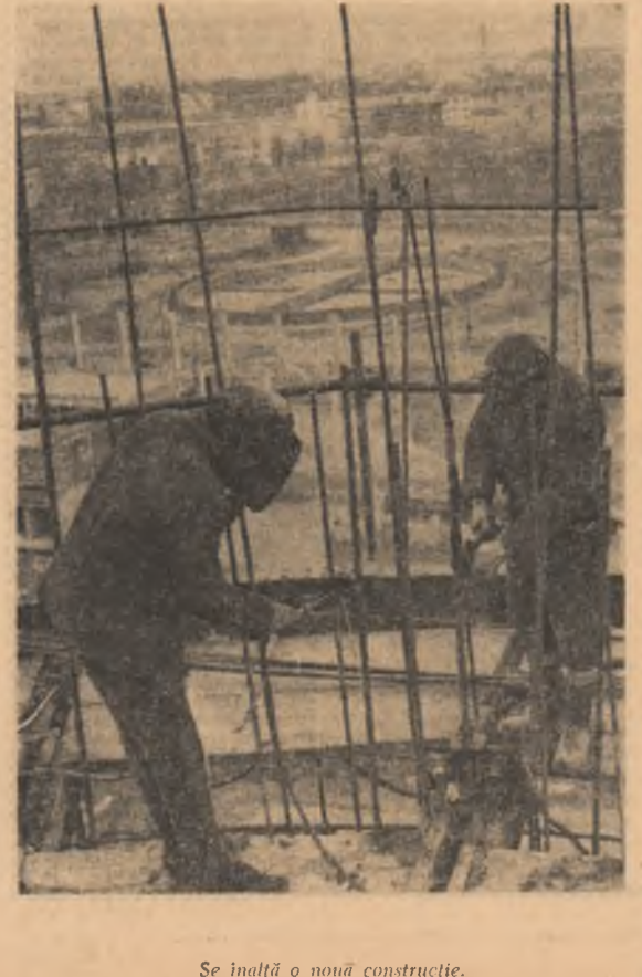
Se înalță o nouă construcție.