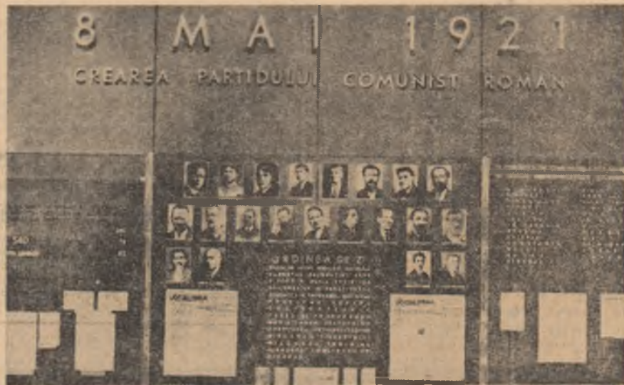
Panoul cu chipurile celor care au deschis primul Congres al Partidului Comunist Român.