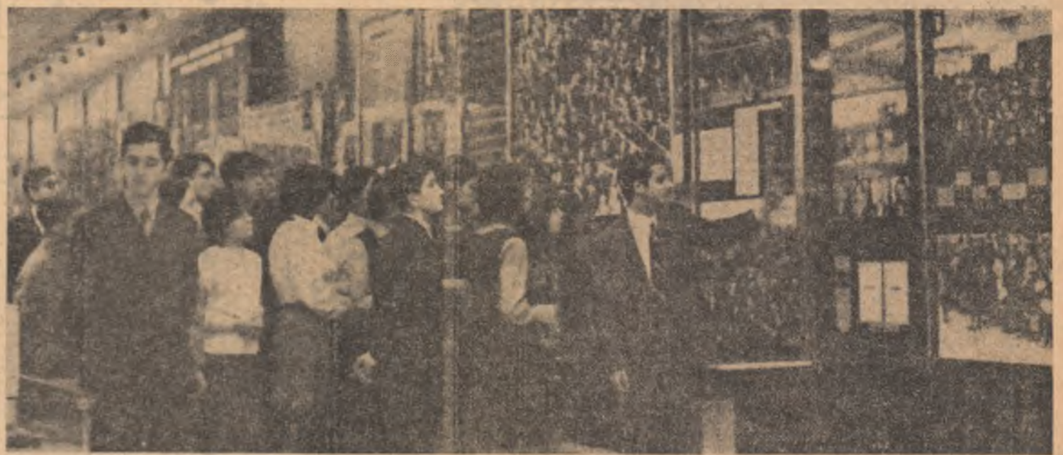
Elevi în vizită la Muzeul de istorie a partidului

barie și atrocități. Nu se poate concepe altfel o conștiință revoluționară decît trecînd prin această amplă desfășurare de ecouri ale unui timp pe care l-au împlinit părinții și strămoșii noștri.