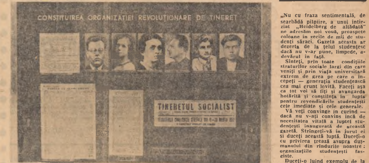
Cei dintîi membri ai Uniunii Tineretului Comunist din România

Da. Aici trebuie să vă demn și curat, cu sufletul deschis ca o garoafă roșie. Aici trebuie să știți să priviți, să știți să descoperiți semnificații pentru tine însuși.