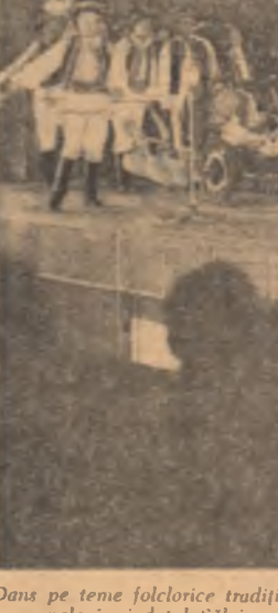
Dans pe țene folclorice tradiționale în județul Sălaj.