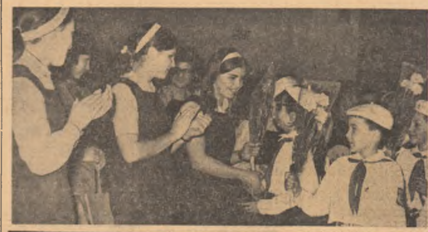
GINDURI LA SĂRBĂTOAREA MAJORATULUI