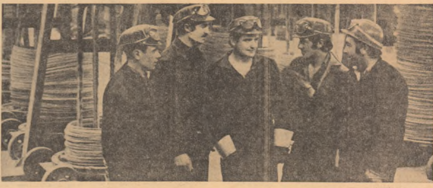
Cei șase din brigada... mai puțin șeful lor

O ACȚIUNE ÎȘI DEMONSTRĂ EFICIENȚA ÎN PRACTICĂ