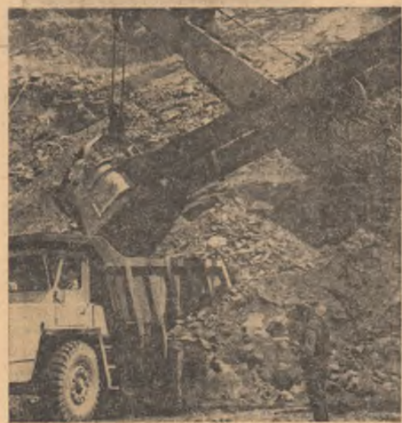
Cariera de piatră de unde se scot anrocamentele pentru umplerea barajului de la Vidra — Lotru.