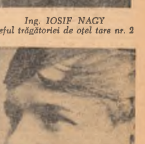
Ing. IOSIF NAGY șeful trăgătoriei de oțel tare nr. 2