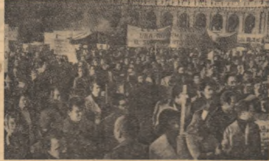
ITALIA. — La Roma s-a desfășurat recent o demonstrație a salariaților din instituțiile medicale. Participanții au cerut încheierea unui nou contract de muncă.