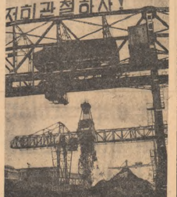
R. P. D. COREEANĂ. — Imagine de la Uzina siderurgică Kim Tchik

La uzina de tractoare din Kiyang, producția de tractoare, îndeplinirea și depășirea sarcinilor de plan.