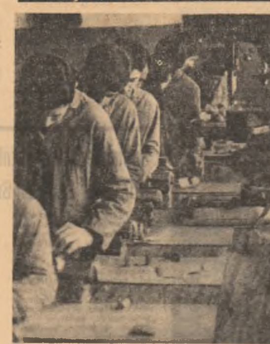
În școlile care dau o profesie, situate pe teritoriul județului Ilfov, elevii au la dispoziție laboratoare moderne, ateliere bine dotate, cadre didactice de specialitate. Depinde numai de ei