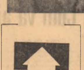
Discuția se leagă ușor, pornind de la sugestiile locului de muncă

Subordonarea sînt de declarată a unei activități complexe prin însăși definiția ei exclusiv la reacția față de „cazuri”. De aici decite, are însă nu numai părți bune, ci — și poate mai ales — tot atîtea părți rele, deoarece îi reduce sfera de cuprindere și eficacitatea exact la jumătate, rămînd numai în limitele „intervenției morale”. Mai mult decît atât, intervenția însăși are loc printr-un apel insistenț la puterea de convingere a negației, nu, cum ar fi mai normal, la valorile afirmative. Manifestîndu-se și prezența nu înaintea, ci după ce s-a întîmplat ceva neplăcut în simțul colectivului, organizația se vede silită să-și limiteze atît de mult la simpla exclamație: „Nu așa!” Cel puțin, dacă s-ar porni de la aceste situații dar nu s-ar rămîne la ele, dacă ar fi folosite ca pretext pentru declanșarea unei activități permanente, care să-și