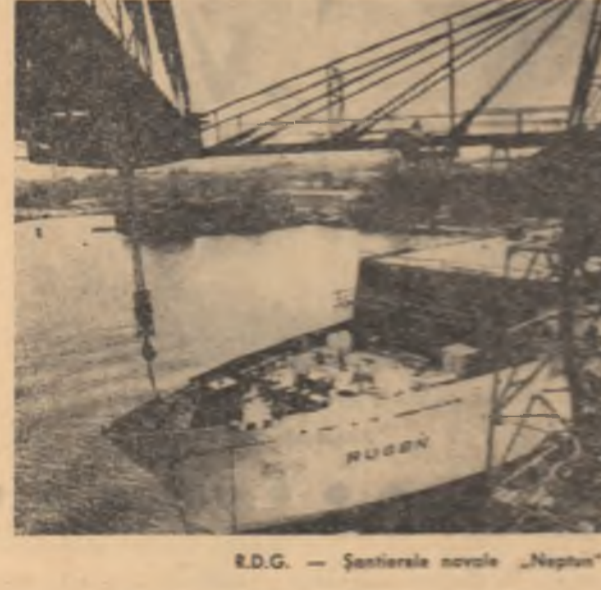
R.D.G. — Șantierul navelor „Neptun” din Rostock.

Ziarul „Gramma” publică un editorial în care respinge declarațiile guvernului Statelor Unite în legătură cu capturarea unei nave-pirată de către autoritățile cubaneze. Guvernul S.U.A. scrie ziarul, a reacționat pe m tot amenințându-l împotriva Cubei după capturarea de către unități