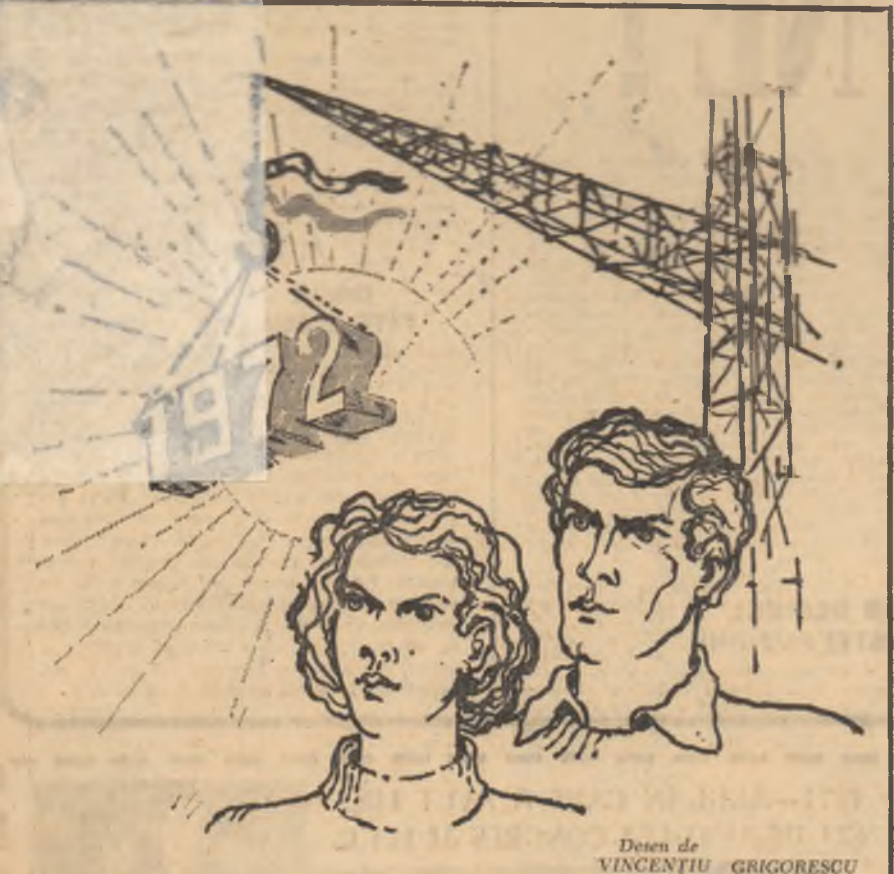
Desen de VINCENTIU GRIGORESCU