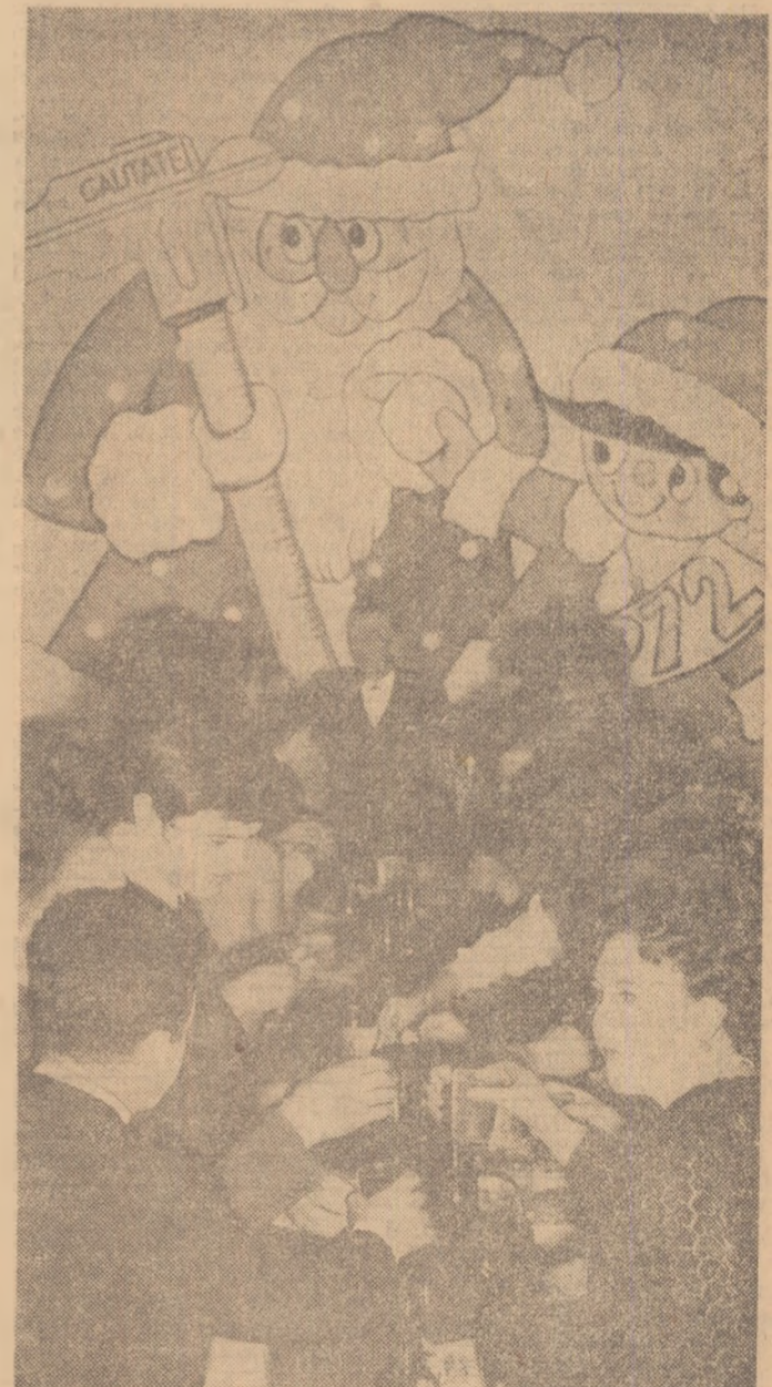
Sosirea Anului Nou a fost un moment de mare bucurie...