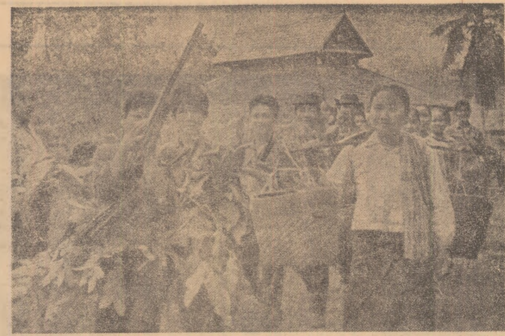
LAOS. — În zonele eliberate ale țării se desfășoară o vie activitate.

BUDAPESTA. — Președintele Consiliului Prezidențial al R. P. Ungare, Pál Losonczi, în cuvîntarea radiotelevizată rostită cu ocazia Anului Nou, a trecut în revistă principalele evenimente interne. Referindu-se la problemele de politică externă, Pál Losonczi a subliniat că anul 1971 a fost caracterizat prin extinderea metodei tratativelor în relațiile internaționale și că în urma eforturilor depuse de țările socialiste, s-a făcut un pas înainte pe calea spre instaurarea unei păci trinitice și a securității pe continentul european. El a exprimat solidaritatea Ungariei cu cei care luptă pentru libertate și independență.