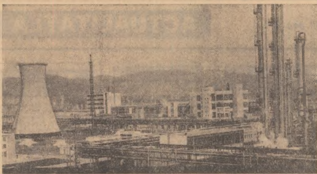
Proletari din toate țările, uniți-vă!

Ca de fiecare dată, colectivul de muncă al marelui Combinat petrochimic Pitești, unul din pilonii de bază ai industriei noastre, raportează, din primele ore productive ale anului, importante succese în contul realizării celui de al doilea an al cincinalului.