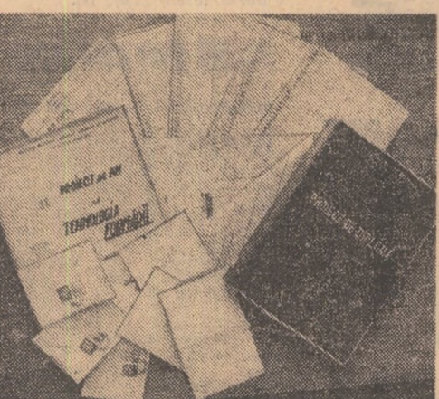
Cîteva din piesele — corp de lect — în cazul la care se referă ancheta de față