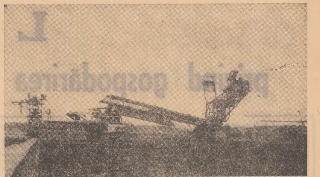
Imagine de la renumita exploatare minieră — Rocinari

ART. 97. — Prezenta lege intră în vigoare după 30 zile de la publicare. Pe aceeași dată, decretul nr. 143 din 4 aprilie 1953 privind folosirea rațională, amenajarea și protecția apelor, precum și orice alte dispoziții contrare prevederilor prezentei legi, se abrogă.