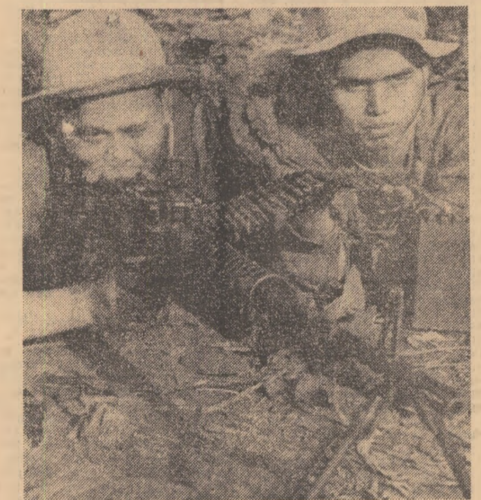
VIETNAMUL DE SUD. — Anul care s-a încheiat a consemnat un bilanț strălucit de succese pentru Frontul Național de Eliberare. În fotografie, o subunitate de patrioți în timpul unei misiuni de luptă