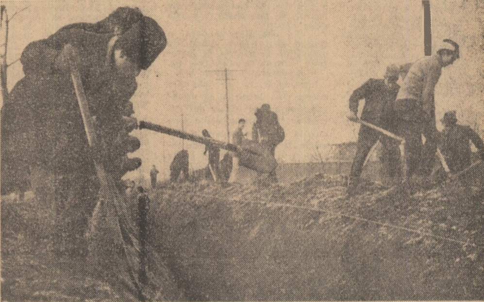
Pe șantierele de desecări

CALIN STANCULESCU (Continuare în pag. a 11-a)