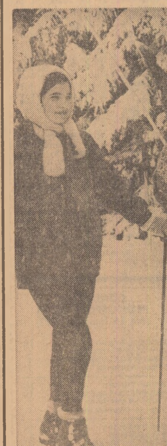
În decorul feriei al pădurii.