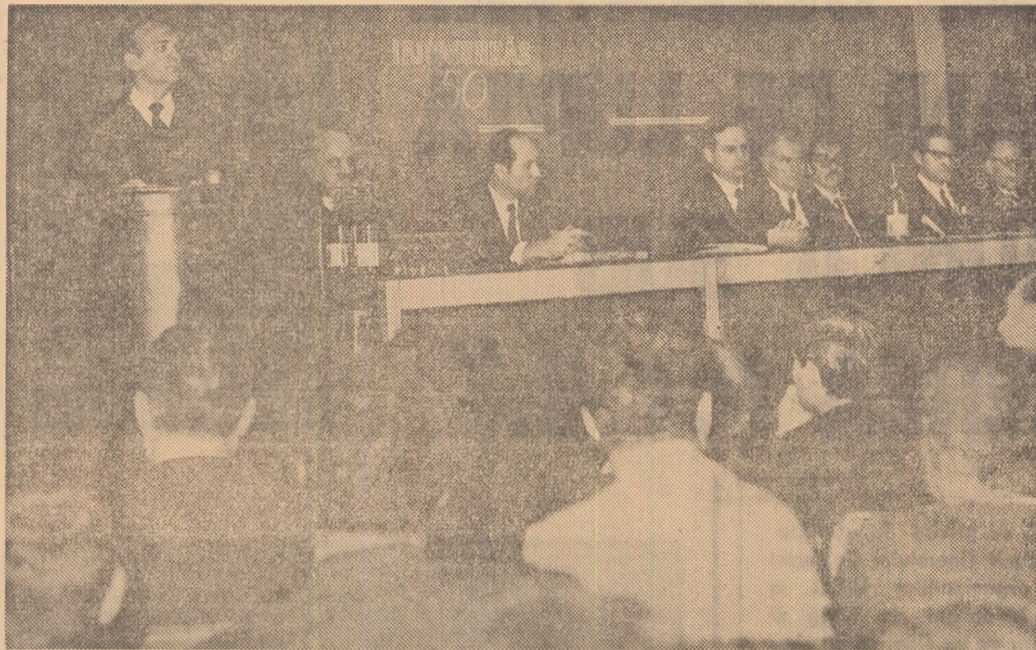
Comitetului Central al Partidului Comunist Roman, tovarășului NICOLAE CEAUȘESCU