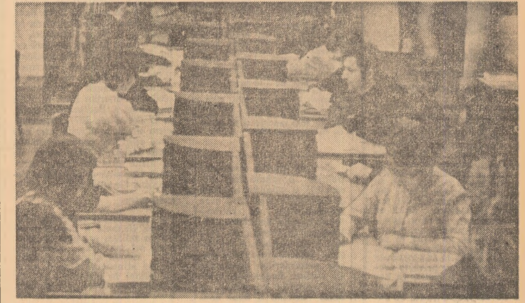
Studiu în biblioteca Universității din Cluj

dezbateri nu se poate împlini în afara unor întîmri simpoziono, mese rotunde cu participarea unor ilegaliști, a unor vechi conducători al organizației U.T.C., a foștilor secretari U.T.C. aflați azi în combinat, sau care avind altă muncă își împlinesc destiul social și uman într-o altă localitate, în vreun alt colț al țării. Asemenea oameni, care au contribuit la edificarea istoriei locale, își amintesc cu plăcere de acei ani, ei înșii vor reconstitui cu ochii de azi ai maturității, momentele de viață și activitate la care au participat cu 15-20 de ani în urmă, punînd în evidență inițiativele, faptele de atunci ale tinerilor. Avem azi un filtru obiectiv, capacitatea, datorată dar și răspunderea de a discerne asupra vîrurilor, asupra experienței noastre; pentru că acest filtru aparține unor oameni care nu mai cu cîțiva ani în urmă erau membri ai U.T.C., iar acum sînt maștri, prim oțelari sau șefi de secții, eroi ai muncii socialiste, deputați în M.A.N. Aceste generații, față în față, vor putea discuta mai sugestiv, mai viu, despre ceea ce înseamnă a fi patriot, a fi revoluționar azi; vor confrunta datele trecutului cu cele ale prezentului și vor vedea care este contribuția lor la tezaurul de luptă și muncă al organizației; vor înțelege mai ușor că istoria organizației U.T.C. este o istorie a curajului, devotamentului și bărbăției gene-