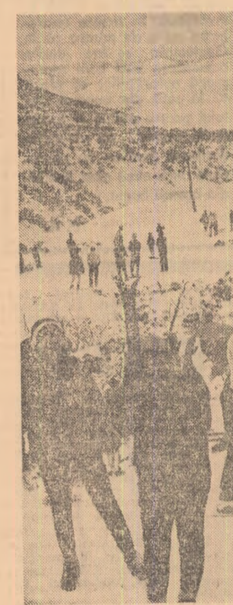
Voie bună, schiuri și zăpadă la Piatra Arsă

— Cred că înșăși istoria de azi a poporului nostru, a organizației noastre naște întrebări pentru realitățile trecutului. Combinatul siderurgic are o organizație de 1.900 de tineri, atât, ce aproape 100 de uteristi de azi ai secției Furnale se pot întreba pe drept cuvânt: oare cîți tineri comunisti vor fi muncitori în trecut?