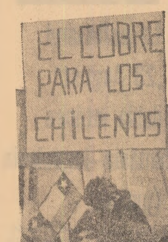
Insemnări de EUGENIU OBREA