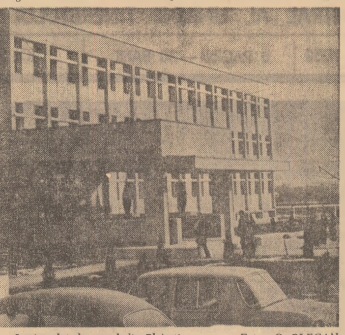
Noua și modernă clădire a Institutului de petrol din Ploesti.

În Editura enciclopedică a apărut volumul „Capitalele lumii”. Lucrarea prezintă monografic toate cele 132 de capitale ale statelor independente de pe glob.