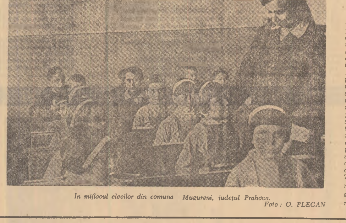
În mijlocul elevilor din comuna Mugureni, județul Prahova.

repara. Cercul tehnico-aplicativ, creat în școală, completează, cred, practica în procesul de învățămînt. Condus de un tehnician de specialitate, cercul facilitează elevilor dobîndirea unor deprinderi în acest sens. Se mai ridică, însă, și următoarea problemă: avem noi profesorii capabili să pregătească economistul modern? Scotesc că în momentul de față liceul poate fi făcut răspunzător de evoluția corpului său profesional. Pentru că, din punctul de vedere al încadrării ei, nu este tratat ca o instituție periferică. Dimpotrivă. Avem un corp didactic pentru care putem fi învidiați: 5 profesori cu gradul I, 6 profesori cu gradul II; alți 8 înscrisi pentru examenele de gra-