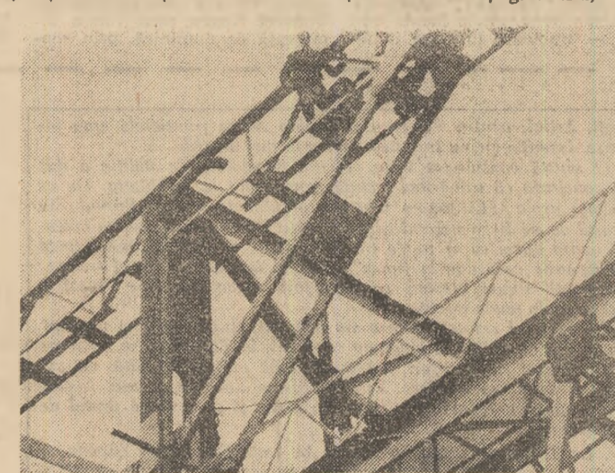
Se naște un nou gigant de oțel