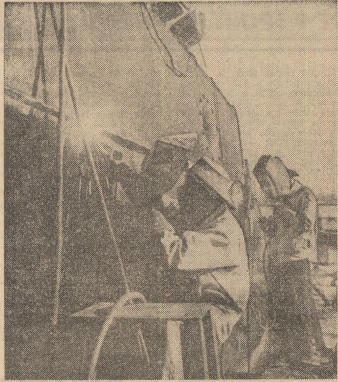
R. D. VIETNAM. — Aspect de muncă de la Șantieretele navale din Haiphong

Secretarul general al O.N.U. a evocat, de asemenea, principalele probleme care stau în fața organizației, rolul ce revine O.N.U. în prevenirea apariției crizelor și în soluționarea acestora. A vorbit despre necesitatea sporirii eficacității O.N.U. în soluționarea problemelor politice și și-a exprimat speranța că Națiunile Unite vor putea face incomparabil mai mult pentru soluționarea situațiilor critice și a conflictelor din viața internațională.