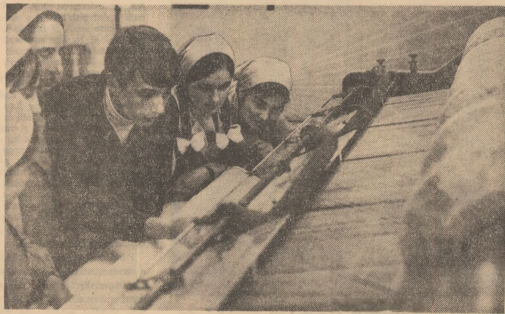
Evident: inițierea în meseria de țesător. Instantaneul ales este realizat la Grupul școlar M.I.U.-Sibiu.