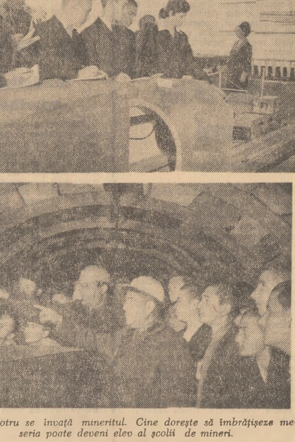
La Motru se învață mîneritul. Cine dorește să îmbrățișeze meseria poate deveni elev al școlii de mîneri.