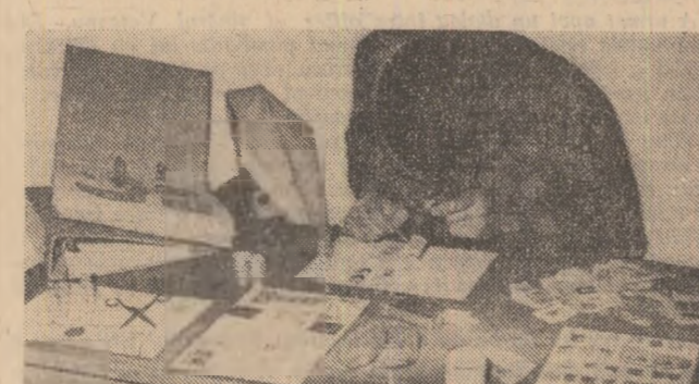
Corpuri delictive pe masa infractorilor: timbre, multe timbre, clasoare, lupe, fiole cu alcool, pensete...