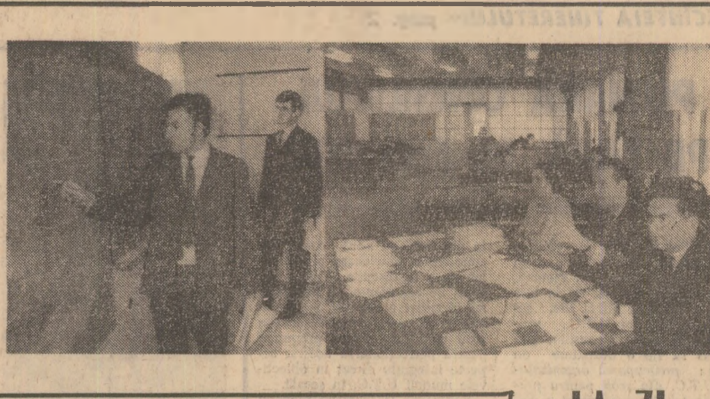
Proletari din toate țările, uniți-vă!