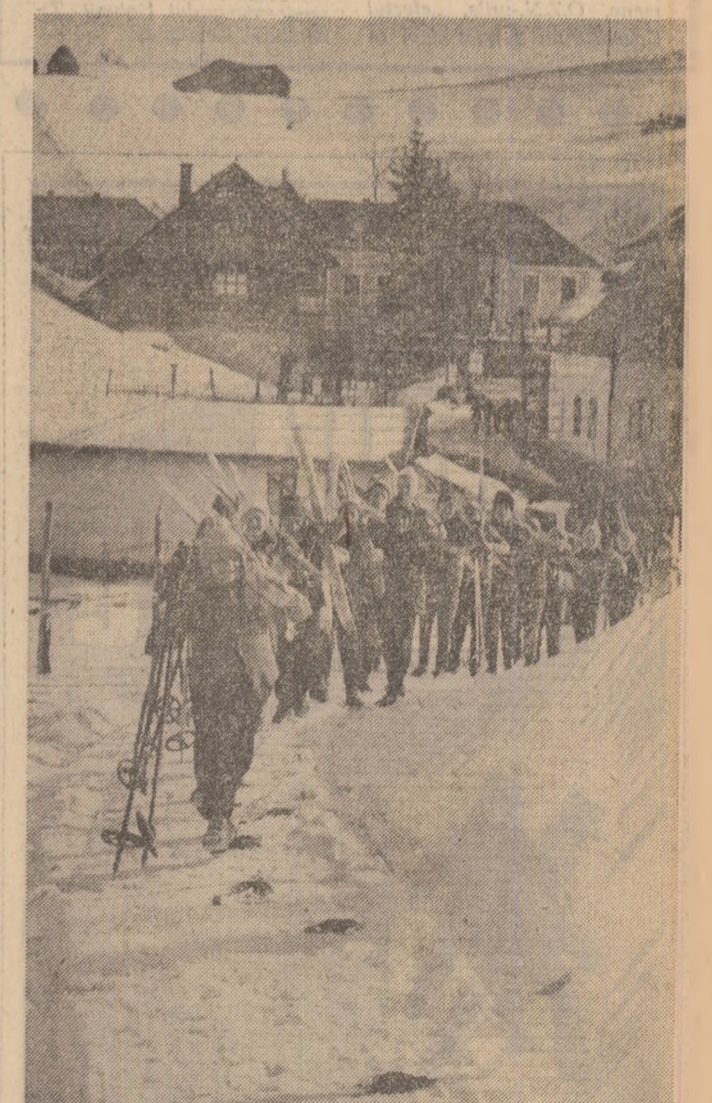
Clopoșelul a sunat de ieșire, în pauză: ora de educație fizică, aici, la Școala generală din satul Sîrmeș, — ca, de altfel, și la Fundata — se face într-un stil cu totul înedit: pe schiuri!