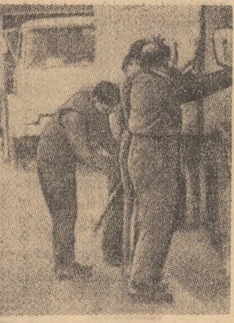
In imagine, militari britanici percheziționând mașini la intrarea în orașul Newry Irlanda de nord

de asemenea, că are intenția de a se deplasa în Republica Sud-Africană pentru a discuta cu oficialitățile de la Pretoria asupra viitorului Namibiei. El a calificat rezoluția prezentată de Argentina la recenta reuniune de la Addis Abeba a Consiliului de Securitate și adoptată în unanimitate drept un real pas înainte pe calea soluționării acestei probleme. În cadrul conferinței de presă, Kurt Waldheim a reafirmat, pe de altă parte, că este dispus să-și ofere bunetele ofițer pentru reglementarea situației din Irlanda de nord, dacă părțile, inclusiv guvernul britanic, i-ar cere acest lucru. Conținând că ministrul de Externe al Republicii Irlanda, Patrick Hillery, și-a adresat un mesaj în acest sens, Waldheim a reamintit că articolul 2, paragraful 7 al Cartei Națiunilor Unite, interzice O.N.U. să se amestece în treburile interne ale statelor.