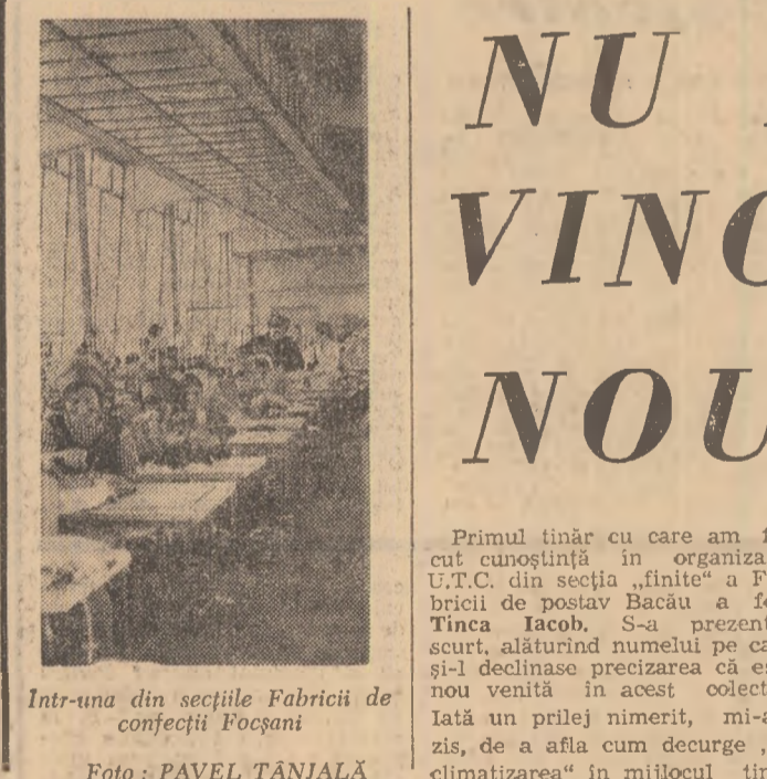
Intra-una din secțiile Fabricii de confecții Focșani

Experiința altor ani, cînd amînarea treburilor de azi pe mîine a scos în primăvară tractoare și utilaje reparate în pripă, pledează ferm pentru intensificarea lucrului. Căci privită prin această prismă primăvara este foarte aproape. Tinerii mecanizatori, parte majoritară a detașamentului de lucrători ai S.M.A., sînt datori și pot să contribuie la grabirea încheierii tuturor reparațiilor planificate.