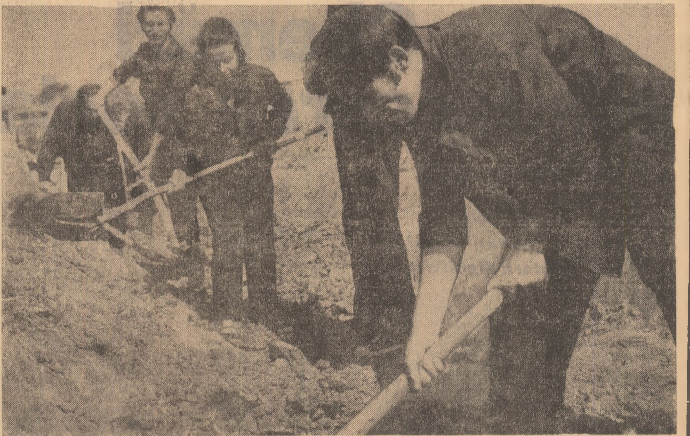
O secvență, una din mitele de secvențe surprinse, de ochiul aparatului de fotografiat, pe șantierele muncii patriotice ale anului 1971