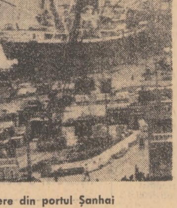
R. P. CHINEZA. — Vedere din portul Șanghai

Patrioții mozambicani au obținut succese importante în acțiunile de extindere a mișcării lor de eliberare națională în provincia Tete din sudul țării.