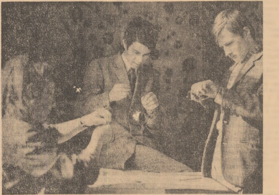
Citiva din elevii din cercul de creație, înscrși cu lucrări proprii la acțiunea „Șantier de lucru”.

— Ce-l caracterizează pe utecistii orga-