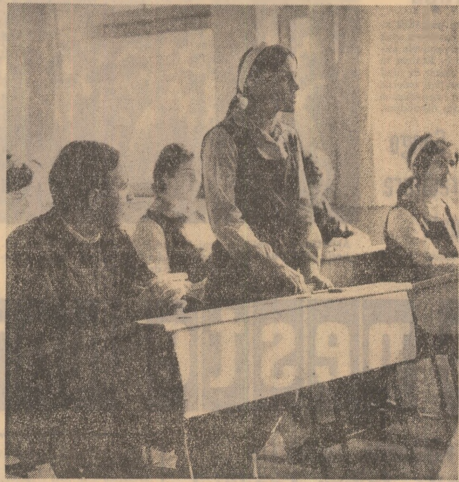
O clasă — o organizație U.T.C.

●GRUPUL ȘCOLAR M.I.U. a intrat în al șaselea an de existență. ●IN CELE PATRU ȘCOLI pe care le găzduiește (profesional și ucenicie la locul de muncă, liceu industrial, cursuri postliceale și de maștri) învață 2.631 elevi. ●LA DISPOZIȚIA ELEVILOR: 33 săli de clasă, 5 ateliere, 4 laboratoare, 3 cabinete, bibliotecă, sală de lectură, sală de expoziție. ●INTERNATUL — 200 de camere; la cantină servesc masa, în două schimburi, 2.500 elevi. ●LA ABSOLVIRE elevii vor fi calificați ca filatori, țesători, tricotieri, confecții textile, finisori confecții, confecții piele, electricieni, scleri — matrișieri, strungari.