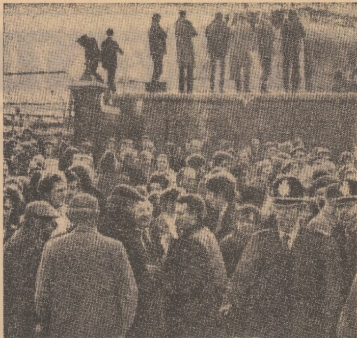
ANGLIA. — Pentru a veni în sprijinul revendicărilor lor, minerii, ajutați de 6.000 de ingineri din Birmingham au închis porțile depozitelor de cărbune