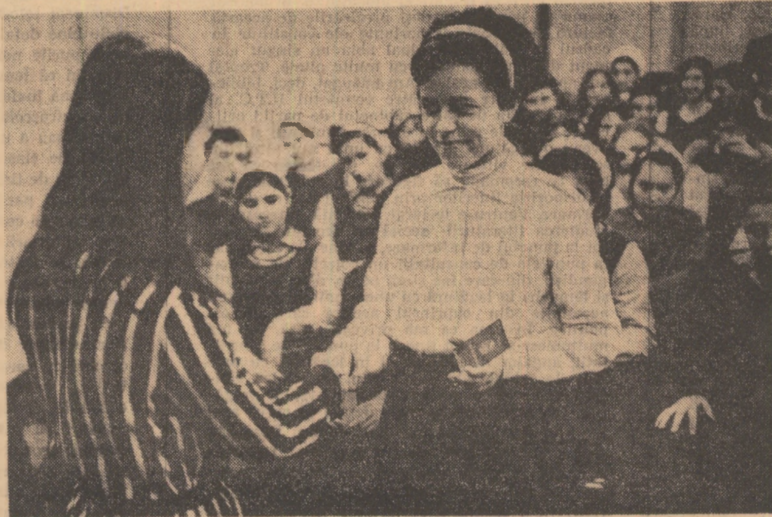
„Primirea în U.T.C. se face la cererea tînrului și se hotărîște în mod individual de cître adunarea generală”.