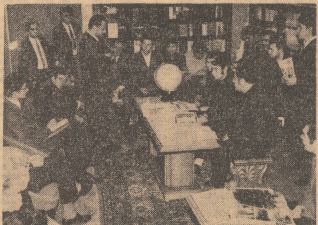
La fața locului, în mijlocul materialelor de documentare și informare, discuțiile capătă un caracter profund, mai practic.

— Despre acest aspect cîteva lucruri reies deja din cele afirmate mai înainte. Se pot adăuga însă și altele. De pildă am facilitat posibilitatea unor organizații de a susține acțiuni proprii, chiar în sediul centrului. Este cazul informărilor politice ale uteciștilor de la Întreprinderea Ciclop, Liceul industrial de chimie sau al altor acțiuni aparținînd tinerilor de la I.C.S.I.M., „Automatica”, unele institute de cercetări și proiectări. La rîndul nostru, ne-am deplasat cu aparatul corespunzător la locurile de muncă ale tinerilor unde am prezentat în cadrul activităților lor specifice unele materiale documentare de care dispunem ca planșe, diapozitive, discuri. În aceste zile se află în plină desfășurare concursul „Pe aici au trecut comuniștii”, care are ca scop cunoașterea unor case memoriale din Capitală și a cărei fază pe sector se va ține la Ateneu. Această acțiune este încadrată în seria celor închi-