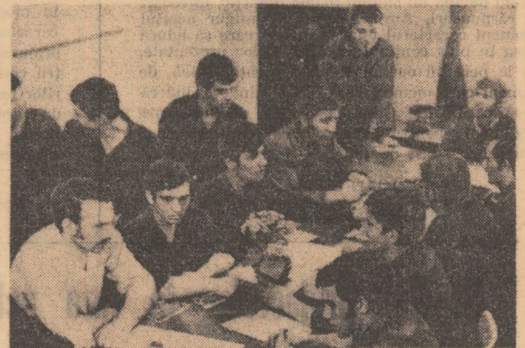
„Organele U.T.C. își desfășoară activitatea pe baza principiului muncii și conducerii colective”.