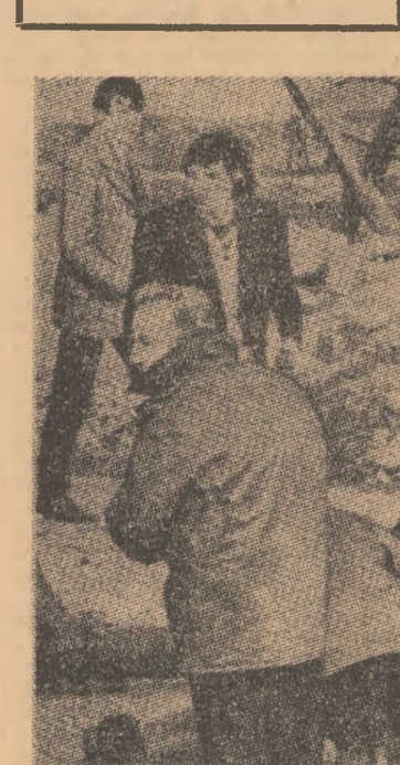
Imagine din timpul recentelor incidente sângeroase din Irlanda de nord