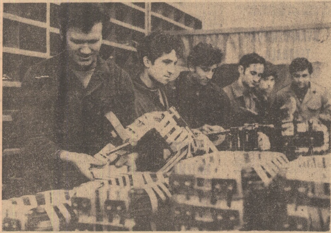
Cot la cot cu muncitorii cîrștici, tinerii celei mai mari uzine craiovene — „Electroputer”, obțin însemnate succese în producție. Azi, în obiectivul fotografic, cițica dintre bobinatori