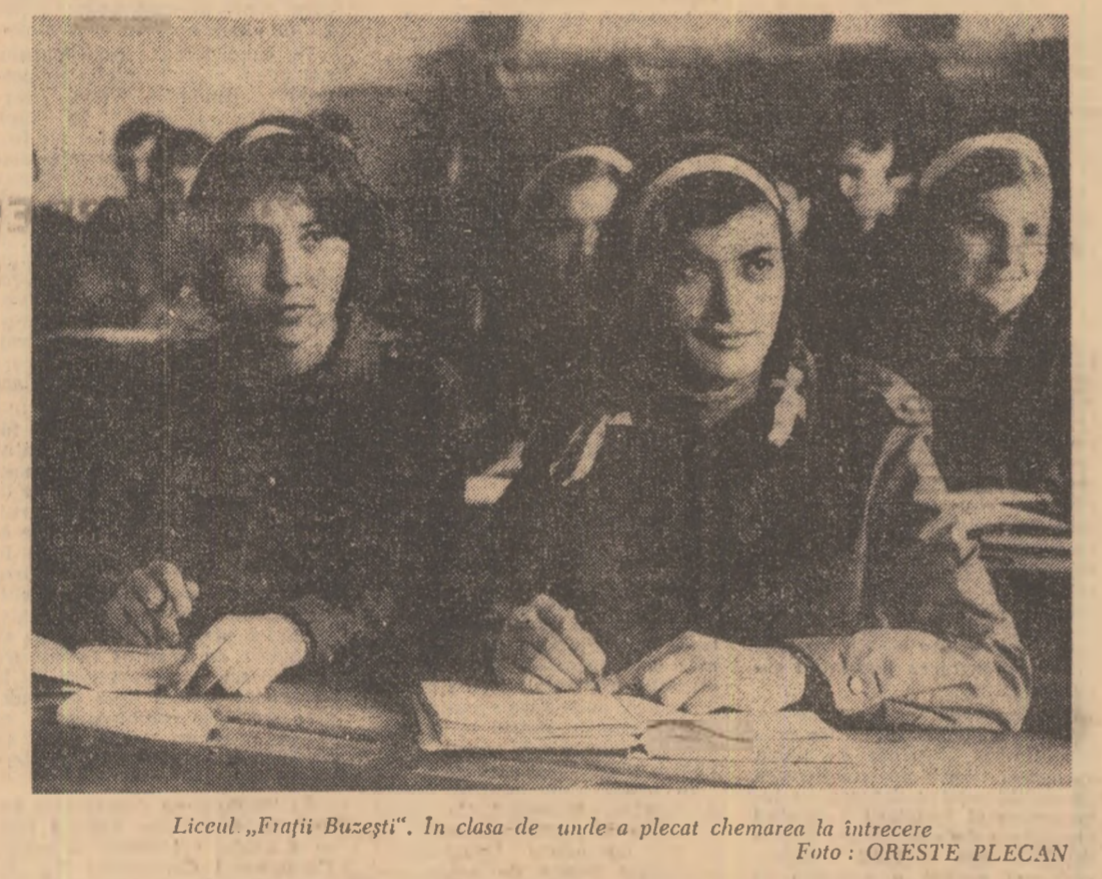
Liceul „Frații Buzești”. In clasa de unde a plecat chemarea la întrecere

Cu bratele și mîntea, actualii și viitorii „industriași” din Birca făuresc o nouă înființare, cu atribuție de urban și civilizație, localității lor natale. OCTAVIAN MILEA