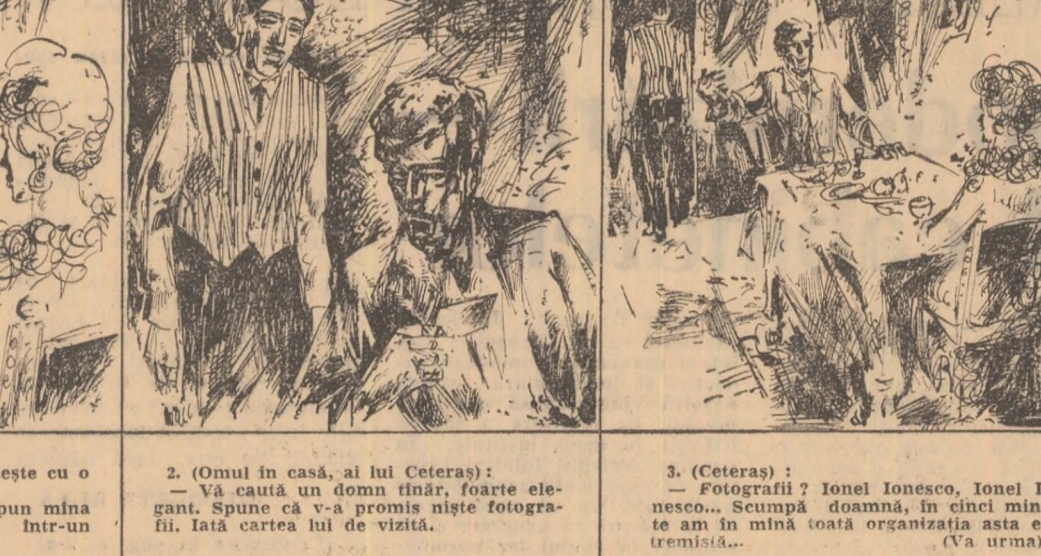
1. (Căsuța a Ceteșar care prinzeste cu o doamnă... 2. (Omul în casă, al lui Ceteșar)... 3. (Ceteșar)...