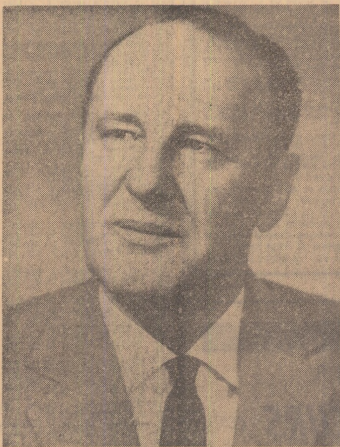
JÁNOS KÁDÁR, prim-secretar al C.C. al P.M.S.U.

Tovarășul Janos Kadar, prim-secretar al Comitetului Central al Partidului Muncitoresc Socialist Ungar, s-a născut la 26 mai 1912, într-o familie de țărani săraci. De timpuriu, la vârsta de 17 ani, a intrat în mișcarea muncitorească. În anul 1932, a devenit membru al Partidului Comunist. De mai multe ori a fost arestat.