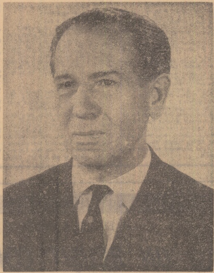
JENŐ FOCK, președintele guvernului revoluționar muncitoresc-țărănesc ungar

După eliberarea țării, tovarășul Janos Kadar a organizat militia democratică. Timp de mai mulți ani, a fost secretarul organizației din Budapesta a Partidului Comunist Ungar, apoi a devenit ministru al afacerilor interne. La Congresul al III-lea al Partidului celor ce muncesc din Ungaria a fost ales secretar general adjunct al partidului. În 1951 a fost arestat pe baza unor acuzații false. Tovarășul Janos Kadar este apoi reabilitat. Este ales secretar al Comitetului de partid al sectorului 13 al Capitalei, iar, după aceea, prim-secretar al Comitetului de partid al județului Pest. În iulie 1956, este ales membru al Biroului Politic și secretar al conducerei centrale a Partidului celor ce muncesc din Ungaria.