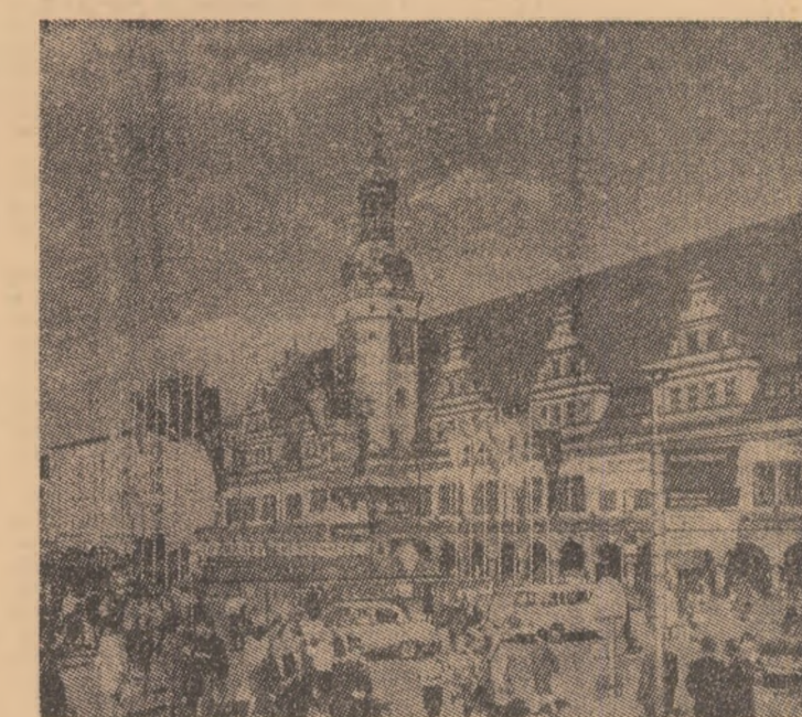
ÎN MARTIE: O NOUĂ EDIȚIE A TÎRGULUI DE LA LEIPZIG

cupată de firme din țările capitaliste. Se remarcă largirea prezentei cercurilor de afaceri japoneze. Din Suedia sînt reprezentate 70 de întreprinderi. Cu de obicei, din R.F. a Germaniei se înregistrează o participare masivă: 700 de firme. Italia, Finlanda, Austria etc. aduc în standurile de la Leipzig o varietate de produse. Peste 20 de țări în curs de dezvoltare își prezintă realizările lor. L-am rugat pe Heiko Rämisch să ne vorbească despre participarea Republicii Socialiste România la tîrgul de la Leipzig, despre aprecierile la adresa produselor industriei românești.