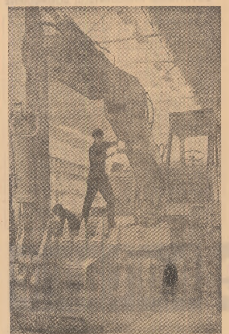
La Uzina „Progresul” - Brăila îți vom reaminti pe mulți dintre cei care acum se gîndesc să deprindă o meserie