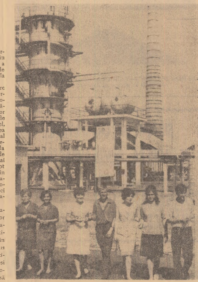
R. P. ALBANIA. — Uzină de îngrășăminte azotoase de la Fier

● O DELEGATIE a Ministerului Comerțului Interior din Republica Socialistă România a purtat, la Tirana, tratative cu reprezentanții Ministerului Comerțului al R.P. Albaniei în legătură cu schimbul de bunuri de larg consum pe anul 1972. La încheierea tratativelor a fost semnat un protocol care prevede o creștere sensibilă a volumului schimburilor de mărfuri alimentare față de anii precedenți.