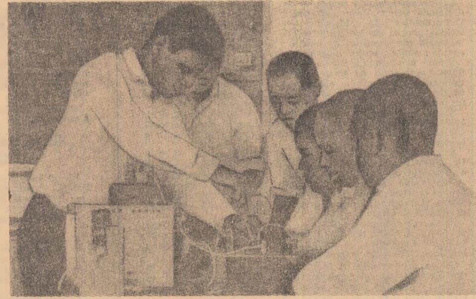
O grupă de studenți în telecomunicații la Kinshasa

La început, studenții veniți din toate colțurile Zairului alegeau cu precădere Universitatea din Kinshasa, cu tradiție mai veche și deci, mai cunoscută. Eforturile autorităților au fost îndreptate spre recrutarea studenților pentru cîtelealte universități tinîndu-se în seamă de două principii: unul geografic și, deci, mai economic și celălalt privind selecționarea tinerilor din cele mai diferite triburi sau grupări etnice.