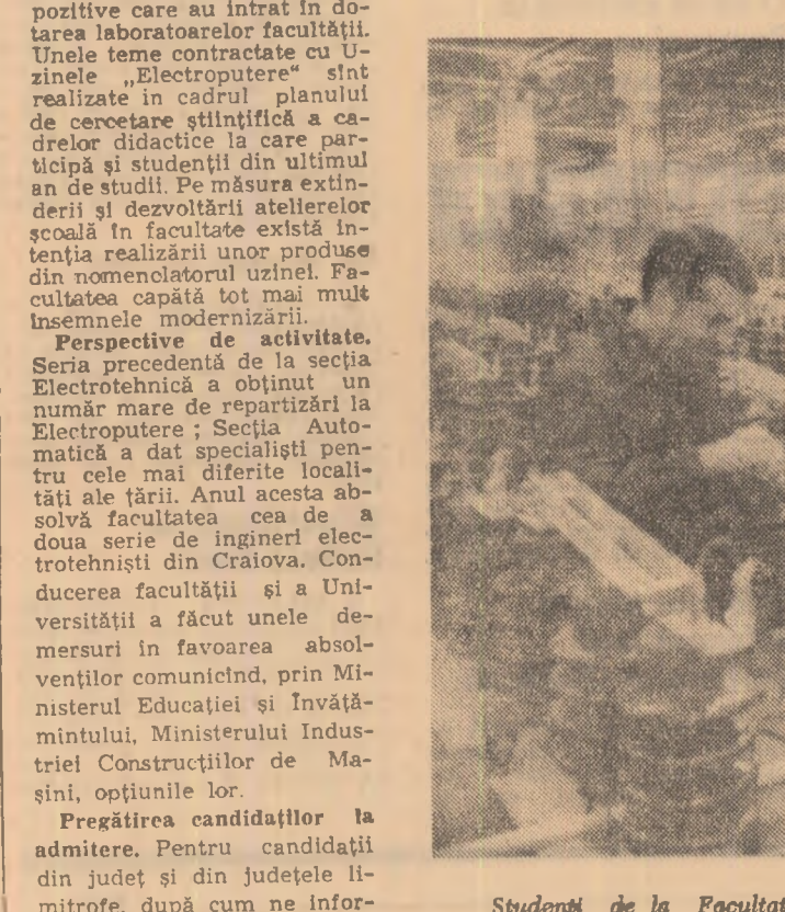
Studenți de la Facultatea de electrotehnică în practică la Uzinele „Electroputere”.