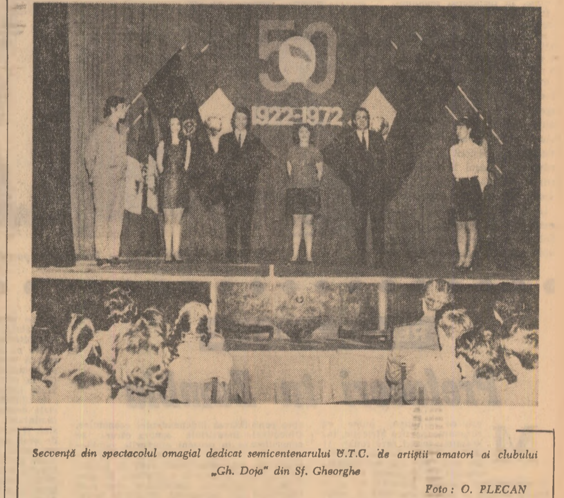
Secvență din spectacolul omagial dedicat semicentenarului U.T.C. de artiștii amatori ai clubului „Ch. Doja” din Sf. Gheorghe

Mimoză, ca niște genunchi de fecioare, Și leandri mai înalți decît sufletul, Parfumatele flori ale sudului Neîterții de frumoase și fragede Blinde ca o împăcare de dragoste. O, în cînta splendoare și gîndurile, Ochii ca pe o colină-ntrebîndu-se blind De ce nu am luat și o batistă cu mine, Călător cu o batistă de pîmint pe care Cu cite trei guri vîntul să sufle l... În palmieri și mîslini umbra soarelui Ca o magnolie culbul privighitorii și cîntecul Florii de portocal împerechină soaciile, Marea în spîinii de aur ai stelelor, Ca niște trîmbițe pe cer, chiparasoale. Precum singele voinicului s-ar fi auzit Darul îmugurîndu-mi în ochi Floarea patrie.