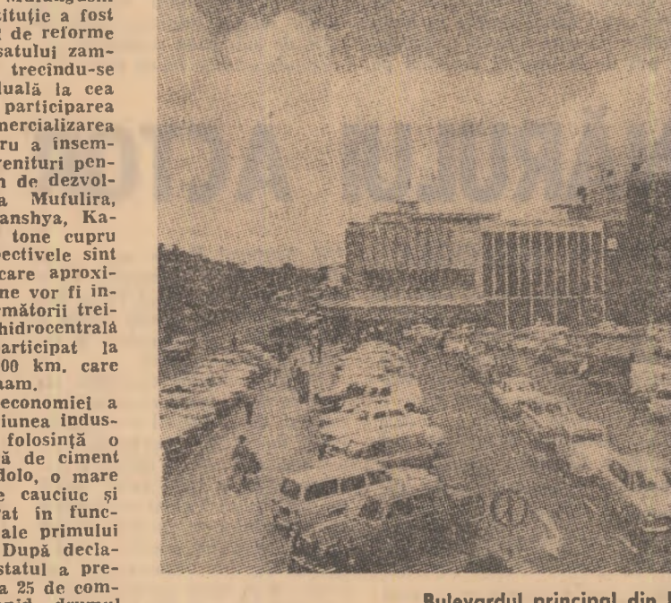
Bulevardul principal din Lusaka

Tendințele protecționiste au atins în Statele Unite cel mai înalt nivel din anul 1929 — în anul marilor crize economice — a declarat liderul majorității democratice din Camera Reprezentanților la S.U.A., Hale Boggs, la o întîlnire a reprezentanților cercurilor de afaceri americane și japoneze, care se desfașoară la New Orleans, favorizînd asupra implicărilor negative ale acestor tendințe pentru dezvoltarea normală a comerțului internațional, Boggs a pledat în favoarea extinderii relațiilor comerciale ale S.U.A.