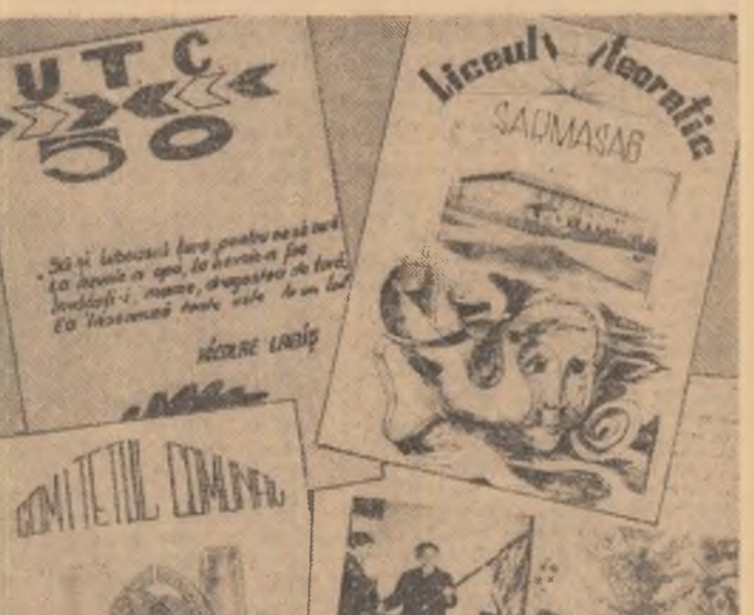
„Cinci albume-stafete, cinci mesageri ai entuziasmului tineresc străbat județul