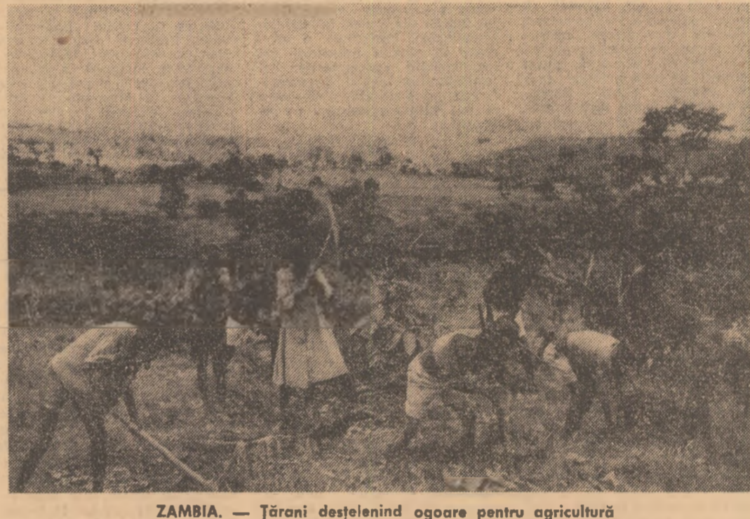
ZAMBIA. — Țărani desțelenind ogoare pentru agricultură

Cancelarul Republicii Federale a Germaniei, Willy Brandt, a declarat vineri la o reuniune politică care s-a desfășurat în orașul Wertheim pe Main, că, în ciuda oricărei opoziții, tratatele cu Uniunea Sovietică și R. P. Polonă vor fi ratificate. El și-a exprimat convingerea că Bundestagul se va pronunța în favoarea ratificării lor, întrucît tratatele corespund intereselor R. F. a Germaniei. Nu există nici o obiecție convingătoare împotriva acestor tratate, a subliniat Willy Brandt, dar există multe argumente în favoarea lor. Fără ele nu poate exista înțelegerea reciprocă cu U.R.S.S. și cu celelalte state socialiste din Europa răsăriteană; fără ele R. F. a Germaniei ar rămîne izolat pe plan internațional, acordul cvadripartit privind Berlinul occidental n-ar intra în vigoare și convorbirile