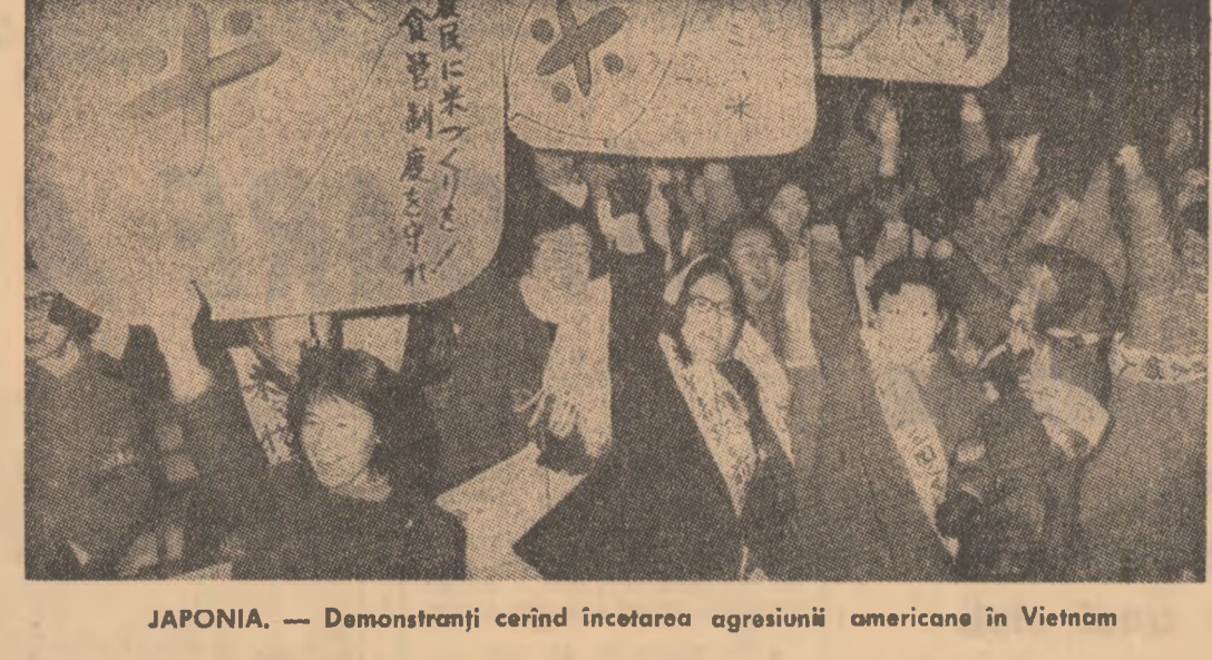
JAPONIA. — Demonstrații cerind încetarea agresiunii americane în Vietnam