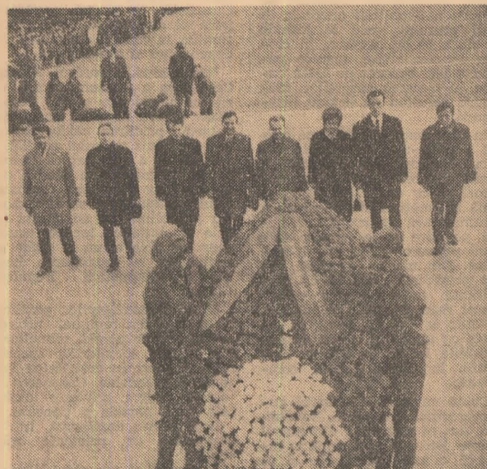
Nomente de reculegere, de ploașă aducere aminte: depunerea unor coroane de flori la Monumentul eroilor luptei pentru libertatea poporului și la Monumentul eroilor patriei.

Duminică au mai avut loc și alte manifestări. În sectorul 4, grupuri de atleti au înmănat o