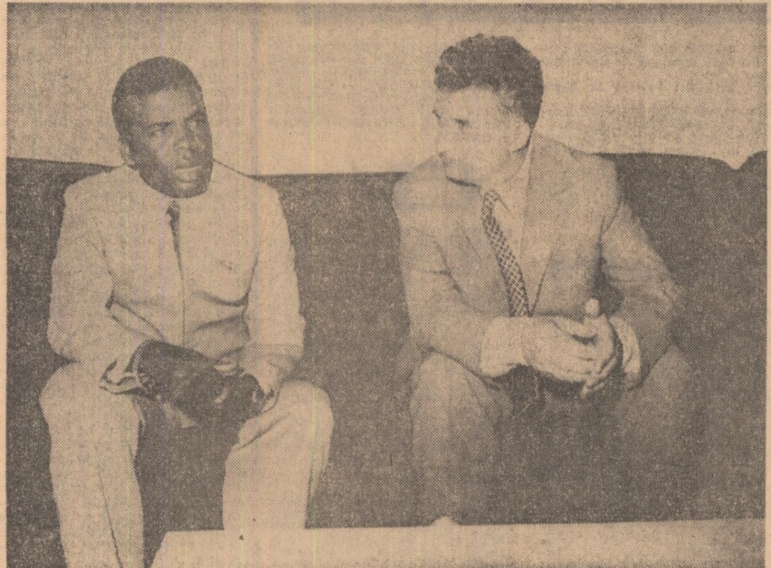
(Continuare în pag. a III-a)