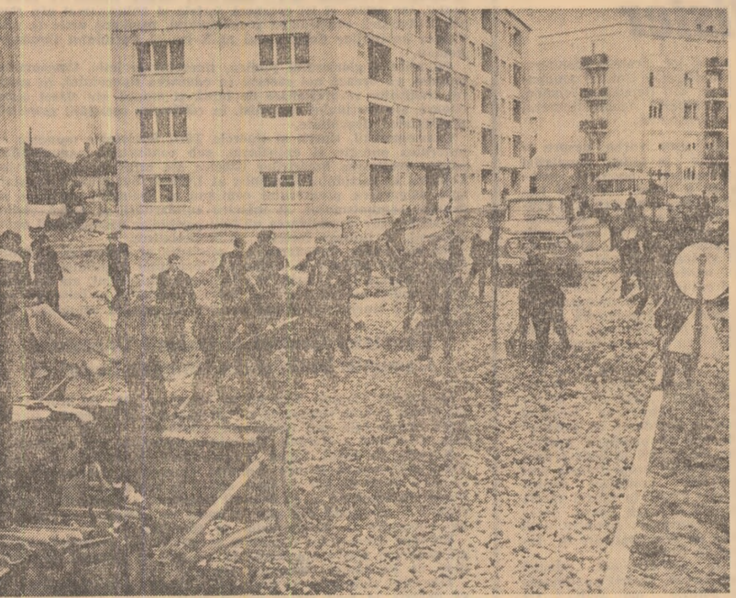
Pe acest loc se va naște o stradă. Pe această stradă vor foști copaci. Și una și alta sînt opera noastră