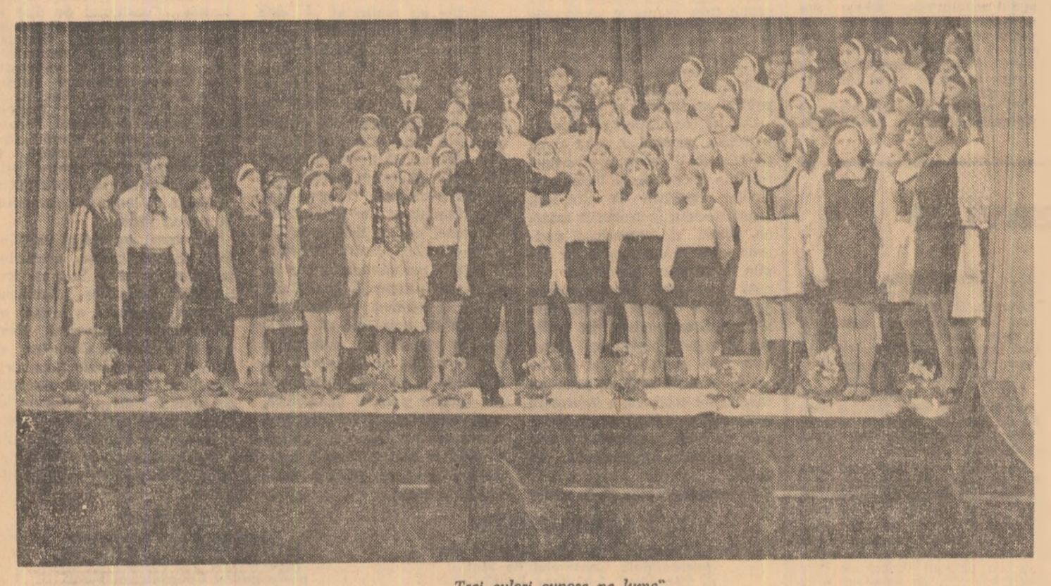
„Treii culori omosc pe lume”