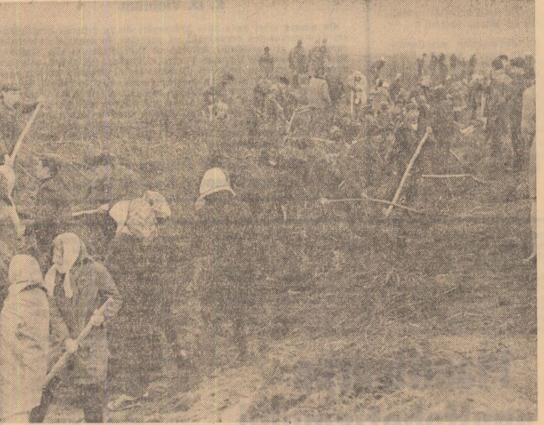
Peste opt sute de tineri au lucrat în „schimbul de onoare al semi-centenarului” pe șantierul de descări Gârliciu din județul Constanța

muncă, dorința fierbîntă de a marca sărbătoarea semicentenarului prin fapte de muncă durabile, dovedesc pe deplin sentimentele și convingerile lor luminoase, dragostea față de partid și cinstita pe care o acordă înaintașilor și contemporanilor, tuturor celor care prin contribuția lor au făcut ca tineretea să ne fie astăzi luminoasă.