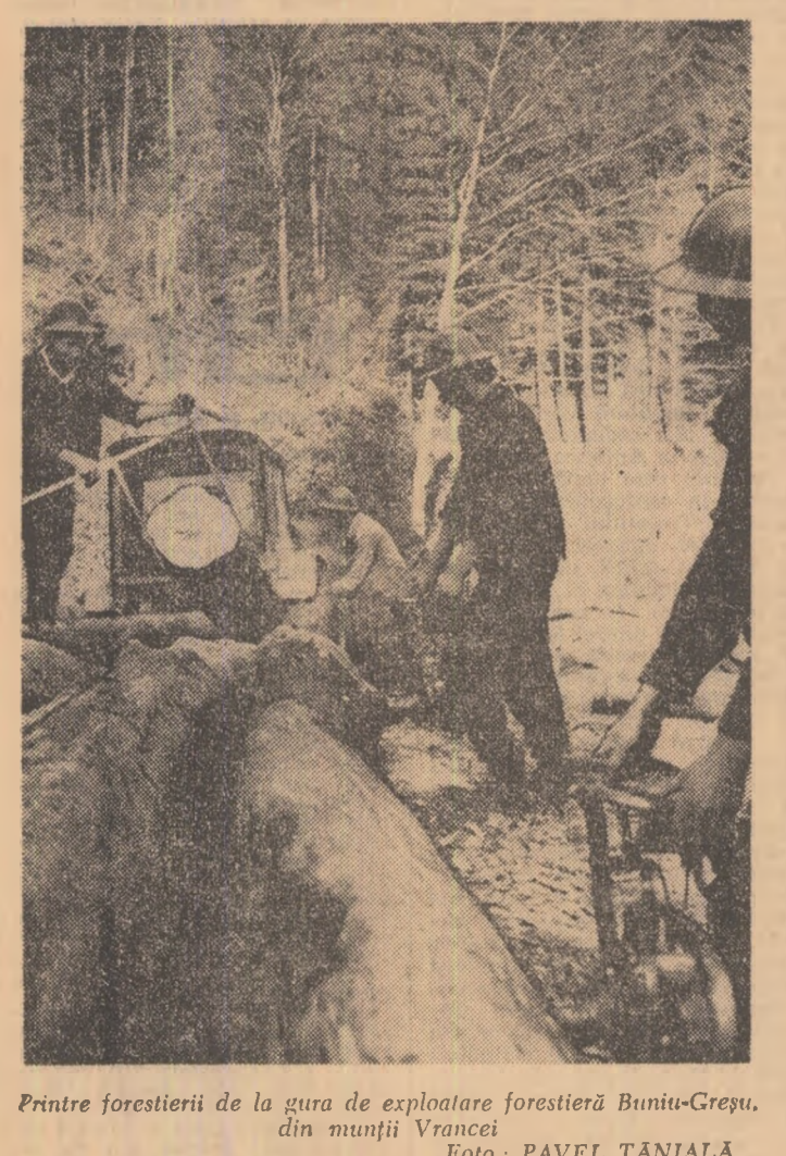
Printre forestierii de la gura de exploatare forestieră Buniu-Creșu, din munții Vrancei.

noastre au cunoscut o puternică dezvoltare. Sper că vizita pe care o facem acum în țara dumneavoastră, convorbirile pe care le vom avea, întâlnirile cu reprezentanții poporului zambian, cu populația din diferite localități pe care le vom vizita, vor contribui, de asemenea, la o mai bună cunoaștere între popoarele noastre, între conducerea statelor noastre, la dezvoltarea ascendentă a relațiilor de prietenie și colaborare, în toate domeniile de activitate. (Aplauze). As dori să vă mulțumesc, domnule președinte, pentru cuvintele de apreciere la adresa politicii internaționale a României, într-adevăr, România duce o politică externă de dezvoltare a colaborării cu toate statele lumii, fără deosebire de orientare socială, punînd, desigur, pe prim plan relațiile cu țările socialiste și cu statele care au scuturat jugul colonial, — cum este și Zambia — și au (Continuare în pag. a III-a)