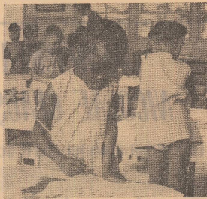
ZAMBIA. — Într-o școală din Lusaka

Printre noii membri ai guvernului se află, de asemenea, Mohammed Al-Imadi, ministru de stat pentru planificare, Jabr el Kafri, căruia i s-a încredințat portofoliul administrației locale, Ahmed Sheikh Said, numit ministru al turismului.