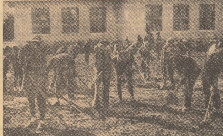
Aici, la Școala generală din Plopporu, va fi gata în curînd, rod al hărniciei elevilor, o adevărată bază sportivă