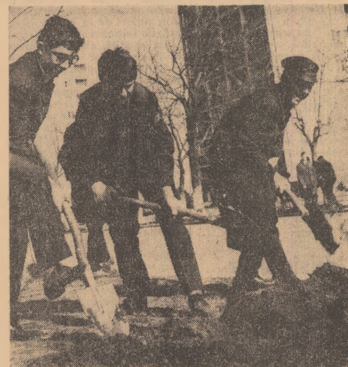
La Buzău, tinerii își dăruiesc energia convinși că numai muncind cu perseverență pot schimba fața și viața orașului