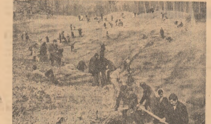
Prezența tinerilor a transformat și aceste locuri într-un șantier al muncii patriotice

Opt noi șantiere Irigațiile, desecările, împăduririle, înfrumusețarea localităților, plantarea în masivele pomicele, tot atîtea acțiuni ale muncii patriotice la care au participat tinerii județului. În ultima duminică a acestui martie jubilar au fost deschise opt noi șantiere de irigații și desecări. La Mirănești, o sută de tineri s-au constituit în brigăzi de muncă patriotică deschizînd șantiere de muncă patriotică pe 180 de hectare piaș acum afectate de exces de umiditate. Pentru această primăvară ne-am propus să încheiem lucrările de desecări, din acest punct de vedere asigurînd condițiile ca toate suprafețele de teren a cooperativei să sint produse. Fiecare noi tineri ne-am întrecut acestui efort. Comandamentul desecării a inclus pe harta șantiereilor ce au cunoscut efervescența muncii și pe cele de la Pielești, Mîhăța, Celaru, Filiași și Mischi. Într-o singură duminică a acțiunilor patriotice, tinerii au contribuit la desecarea cîtorva sute de hectare. Adăugîndu-le suprafața cîștigată pentru producție, prin lucrările ample de combatere a corozivității solului de la Gogosu, Argetoia, Salcia, Carpen și Gleanov, acțiunile pe nisipuri însumăm cîinci sute patru hectare terenuri care vor produce în echivalent porumb.